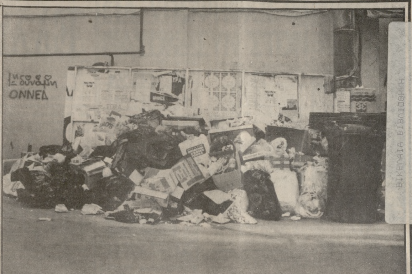
Χιλιάδες τόνοι σκουπιδιών στους δρόμους της πόλης.

υθολογίες Νομάρχη και Εισαγγελέα τις παρανομίες του ο Δήμος. Αλλά χωρίς εγγυήσεις δεν φεύγουμε. Ο Νομάρχης Ηρακλείου μας είχε δώσει αρχικά δείγματα συμπεριφοράς συνेतου ανθρώπου. Αλλά κάθε μέρα που περνά φαίνεται πως βάρηκε να χαλάσει την καλή εικόνα. Τον πληροφορούμε πως ο Νόμος είναι για το δικαίο κι όχι για το άδικο, κι αυτό να εφαρμοστεί».