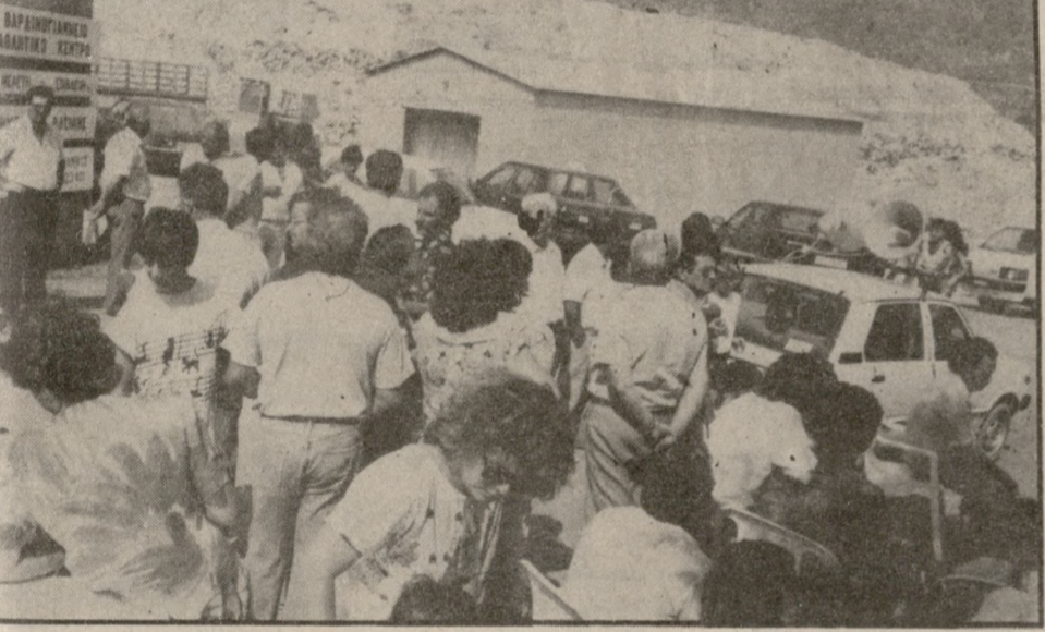
Κατά πλειοψηφία η επιτροπή των καταληψιών αποφάσισε αργά χθες το βράδυ την αναστολή της κατάληψης του Σκαφιδαρά ως τις 20 Αυγούστου προκειμένου να δοθεί η δυνατότητα στις αρμόδιες υπηρεσίες για την εξεύρεση της νέας χωματερής.