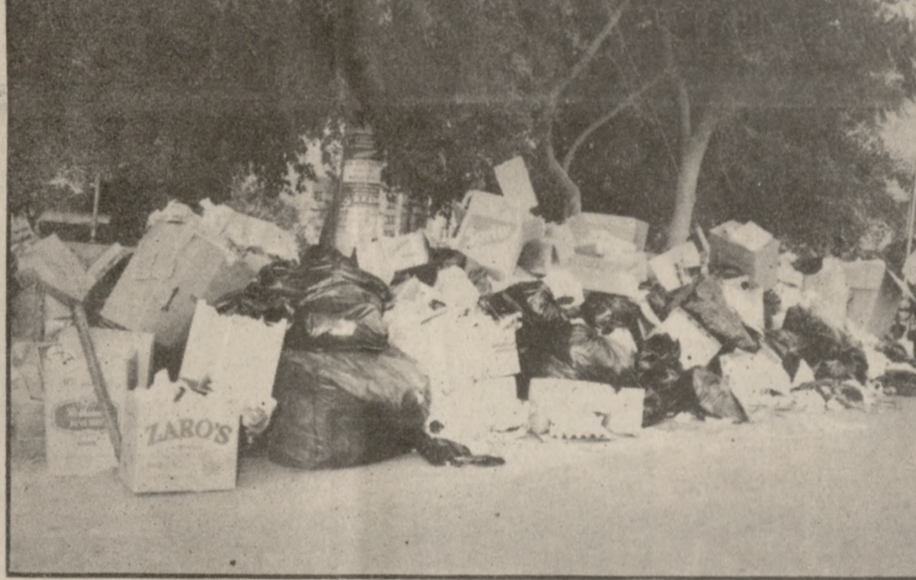
Κατά πλειοψηφία η επιτροπή των καταληψιών αποφάσισε αργά χθες το βράδυ την αναστολή της κατάληψης του Σκαφιδαρά ως τις 20 Αυγούστου προκειμένου να δοθεί η δυνατότητα στις αρμόδιες υπηρεσίες για την εξεύρεση της νέας χωματερής.

την αναστολή για 15 μέρες της κατάληψης της χωματερής του Σκαφιδαρά αποφάσισε η γενική συνέλευση των καταληψιών, χθες αργά το βράδυ, προκειμένου να δοθεί το χρονικό περιθώριο στην επιτροπή που συγκρο-