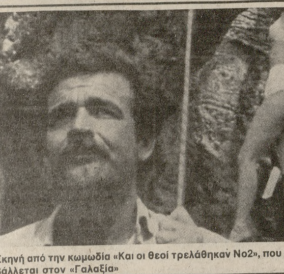
Σκηνή από την κωμωδία «Και οι θεοί τρελάθηκαν Νο2», που προβάλλεται στον «Γαλαξία»

Κανέναν. Το μόνο που του μένει να κάνει είναι να εκδικηθεί τον άντρα που τον ανάγκασε να προδώσει την αγαπητή της γιαγιάς του και να αμαρνώσει το όνομα του γιου του. Τον Αχμέτ Ντζίντα, που «σκότωσε» κάθε του ευνεριο να γίνει πλούσιος κι ευτυχιμένος. Τα χρόνια περνούν κι ο γιος του μεγαλώνει. Έχει κι αυτός τα ίδια όνειρα με τον Περχάν και αποφασισμένος όπως είναι να τα δει να πραγματοποιούνται θα ξεκινήσει για μια νέα περιπέτεια.