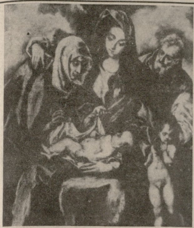
«Η Αγία οικογένεια» έργο του Γκρέκο που εκτίθεται στο Ηράκλειο από την εθνική πινακοθήκη της Ουάσιγκτον

ΤΡΙΤΗ 7 ΑΥΓΟΥΣΤΟΥ ΓΡΑΦΕΙΑ: Θεσσαλονίκης 2-Τ ΣΥΝΤΑΞΗ: Λάππα 7, Μασσαρά ΗΡΑΚΛΕΙΟ - ΚΡΗΤΗ ΔΙΕΥΘΥΝΣΗ: ΣΥΝΤΑΞΗΣ: 258.079, ΔΙΑΧ/ΣΗΣ: 282.625, TELEFAX