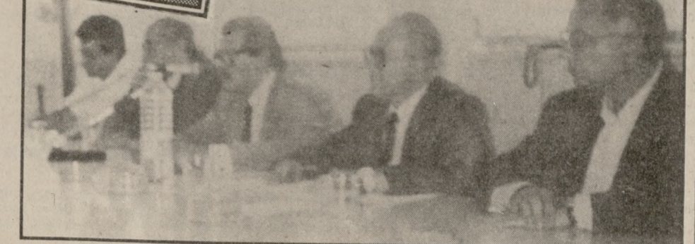
Θέματα κυρίως χρηματοδότησης των συνεταιρισμών τέθηκαν προχθές στον Διοικητή της ΑΤΕ από τους εκπαιδευτικούς των συνεταιριστών

«Η ΑΤΕ πρέπει να πάρει την οριστική μορφή της υποστήριξης ο κ. Κεφαλογιάννης και αυτή θα είναι αγροτική, αναπτυξιακή, εμπροχική, με στόχο να αποκτήσει τις δυνατότητες ώστε να μπει δυναμικά στο πεδίο του διεθνούς ανταγωνισμού».