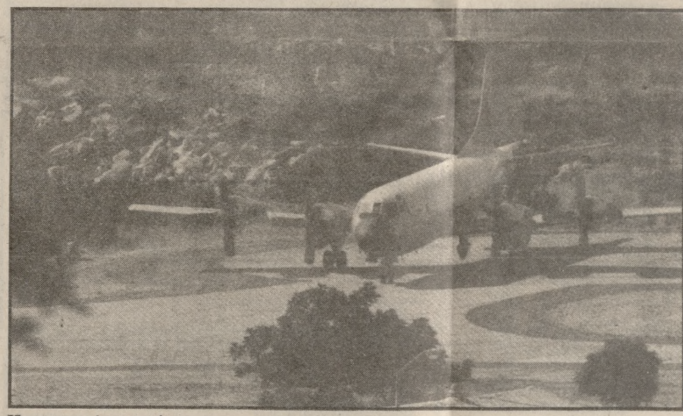
Η αποκρυπτική φωτογραφία στο σχετικό ρεπορτάζ της εφημερίδας "Επικαιρότητα" που προκάλεσε την ομολογία της κυβέρνησης αργά χθες το βράδυ.

Όπως επεσήμανε ο κ. Πολυδώρας υπάρχει δυνατότητα διέλευσης αεροσκαφών έξω από το FIR Αθηνών-νοτιώς της Κρήτης-χωρίς να υπάρχει δεδομένος αεροδιάδρομος. Με αυτό τον τρόπο,