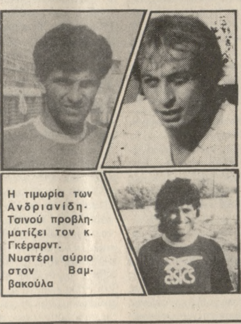
Η τιμωρία των Ανδριανιδών. Τσιονίσις τον κ. Γκέραρντ. Νυστέρι αύριο στον Βαμβακούλα