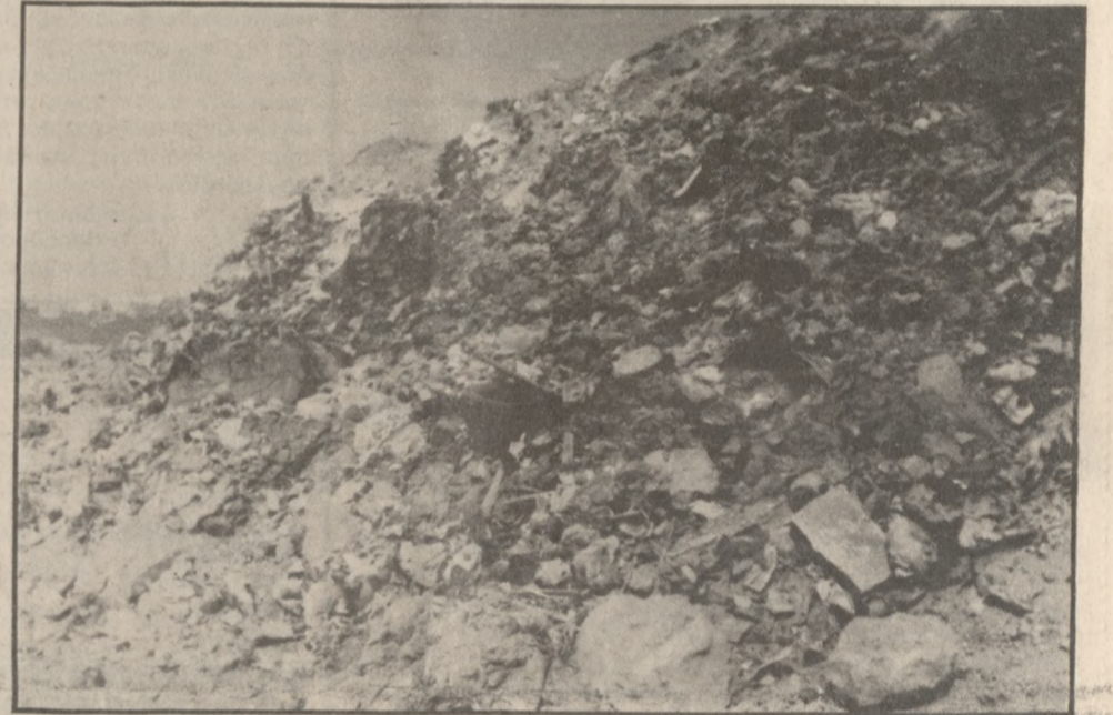
Ο χώρος του Σκαφιδάρα χθες το μεσημέρι

Πυρκαγιά ξέσπασε χθες το πρωί στη χωματερή Σκαφιδάρα, με πιθανή αιτία την αυτανάφλεξη των σκουπιδιών. Όπως μας ενημέρωσε η Πυροσβεστική Υπηρεσία στο χώρο της πυρκαγιάς κατέφθασε ένα όχημα της υπηρεσίας με τη βοήθεια του οποίου σβήστηκε ένα μέρος της φωτιάς ενώ ένα άλλο ε-