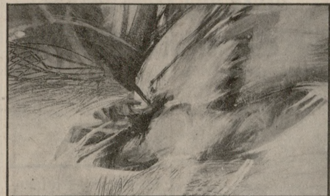
Ο Ν. Βισκαδουράκης έχει συμμετάσχει σε πολλές ομαδικές εκθέσεις ενώ έχει κάνει ατομικές παρουσίες σε γκαλερί του Ηρακλείου και του Ρεθύμνου.