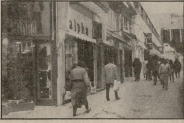
συνέχεια στη σελ. 3

Όπως λέει ο ίδιος θα πρέπει να συμφωνηθεί από τα σωματεία ένα ανθρωπινό ωράριο για τους εμπόρους το οποίο όμως θα εξυπηρετεί και το καταναλωτικό κοινό. Σύμφωνα με πληροφορίες το εβδομαδιαίο πλαίσιο του ωραρίου θα είναι σε 48ωρη βάση. Όμως, όπως είναι γνωστό η απελευθέρωσή του, από την 1η Σεπτεμβρίου θα δημιουργήσει ενδεχομένως προβλήματα