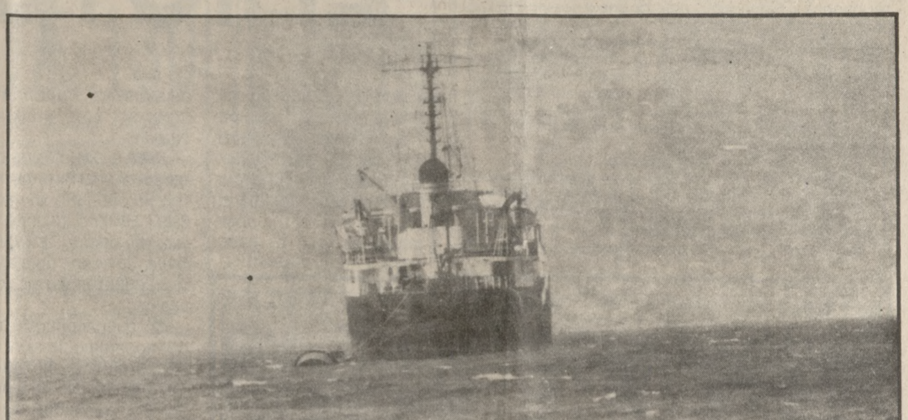
Θα εξφορτώνει αύριο και πάλι πετρέλαιο το "Πάμος" μετά την επισκευή της βλάβης στον αγωγό.