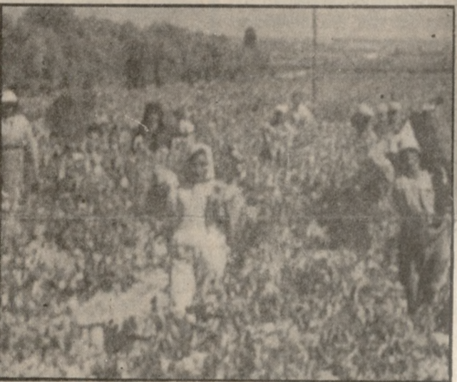
Σταματά από σήμερα η κοπή των σταφυλιών

«Ούτε ένα κιλό επιτρέπει σταφυλιού δεν πρόκειται από σήμερα να κοπεί και φυσικά να εξαχθεί από τους εξαγωγικούς φορείς του Νομού, μετά από την απόφασή τους να σταματήσουν οι σχετικές διαδικασίες, επειδή η κόστος είναι κατά πολύ υψηλότερο από την τιμή πώλησης, του σταφυλιού».