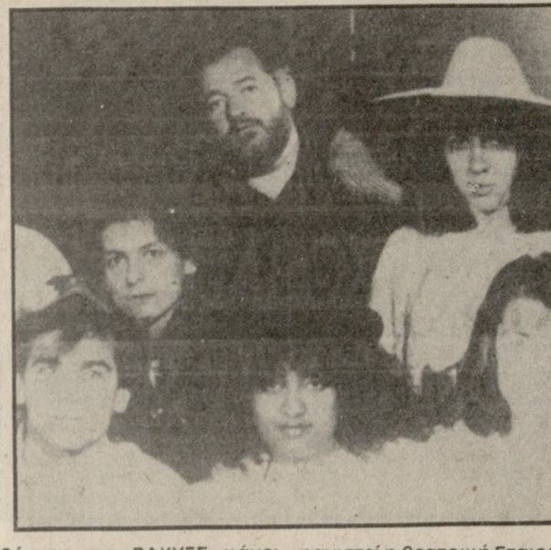
Θέατρο τις ΒΑΚΧΕΣ κάνει πρεμιέρα - πρώτη πανελλήνια παρουσίαση - της τραγωδίας «ΠΕΡΣΕΣ» του Αισχύλου στο Μικρό Δημοτικό Κηποθέατρο, όπου δίνει δύο παραστάσεις την Παρασκευή και το Σάββατο 24 - 25 Αυγούστου στις 10 το βράδυ.

Συγκεκριμένα η θεατρική Εταιρεία ΑΤΤΙΣ που μας παρουσιάζει περυσί στο Κηπο-