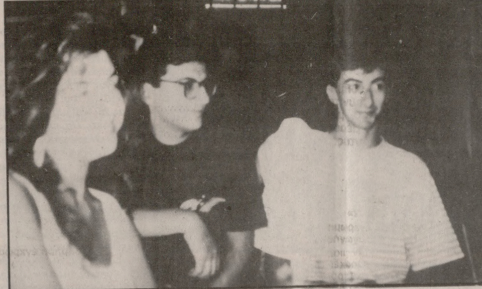
Γνωρίζω τον ζωγράφο αλλά όχι την έκθεση θα πει ο κύριος της φωτογραφίας.