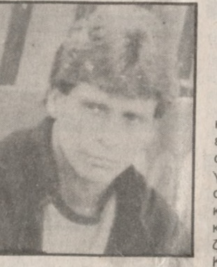
Για την ενδεκάδα που σκεπτεται να παρατάξει στην Τούμπα...

οίσασαν από την πρωινή προπόνηση για να ξεκουραστούν από τη συμμετοχή τους στον προχθεσινό αγώνα που έγινε προς τιμήν του Ρόστα.