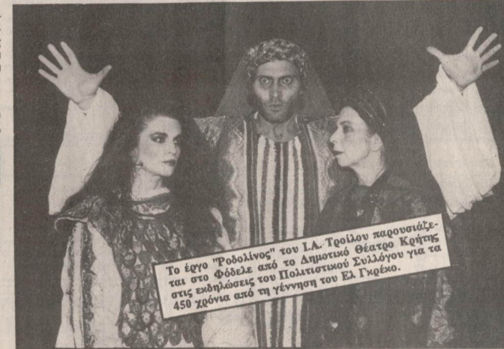
Το έργο 'Ροδολίνος' του Ι.Α. Τρωίλου παρουσιάζεται στο Φόδελε από το Δημοτικό Θέατρο Κρήτης στις εκδηλώσεις του Πολιτιστικού Συλλόγου για τα 450 χρόνια από τη γέννηση του Ελ. Γκρέκο.