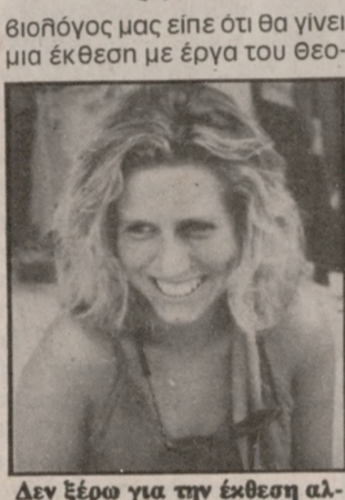
Δεν ξέρω για την έκθεση αλλά αν εννοώ μπορώ να φύγω λέει η τουρίστρια στη Βασιλική.