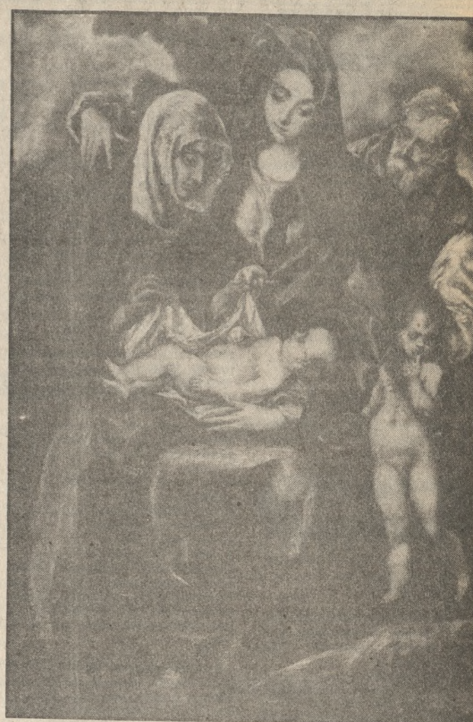
Κατόπιν επισταμένης μελέτης όλης της βιβλιογραφίας για το Δομ. Θεοτοκόπουλο που υπάρχει στην Εθνική Βιβλιοθήκη, αναφέραμε τις θέσεις και τις απόψεις μερικών γνωστών μελετητών πάνω στο θέμα της γενέτειράς του.

Ηλία Δεβέλιτσοβ Θέσεις-Απόψεις για την γενέτειρα του Δομ. Θεοτοκόπουλου