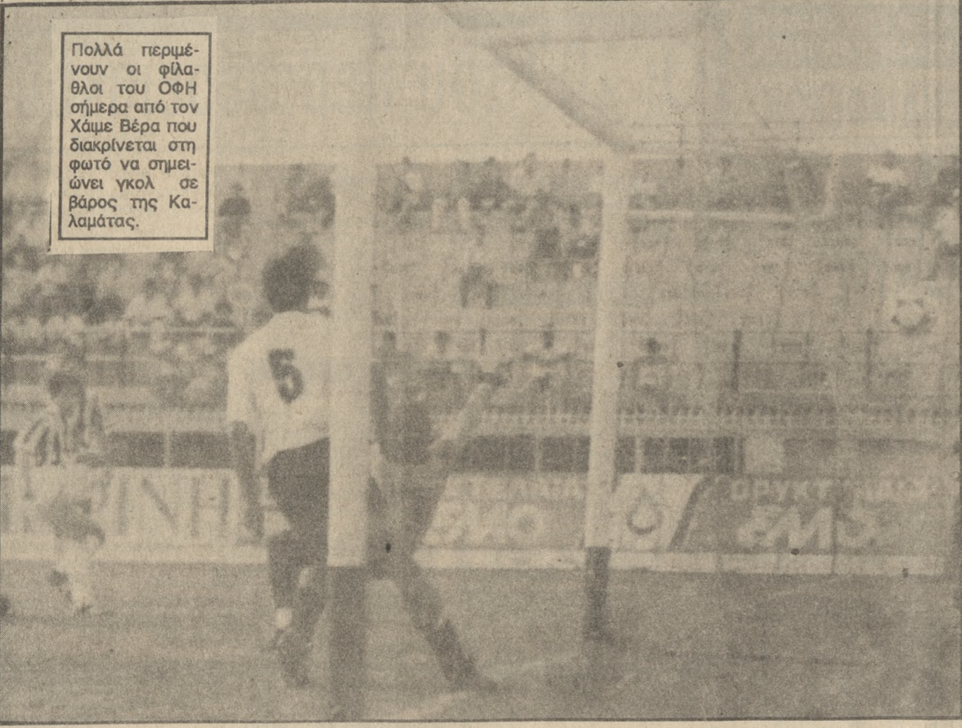
Πολλά περιμένουν οι φίλαθλοι του ΟΦΗ σήμερα από τον Χάιμε Βέρα που διακρίνεται στη φωτό να σημειώνει γκολ σε βάρος της Καλαμάτας.