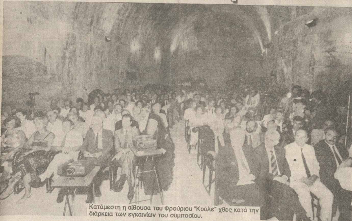
Κατάμεστη η αίθουσα του Φρουρίου «Κούλε» χθες κατά την διάρκεια των εγκαινίων του συμποσίου.

Γέμισε χθες το πρωί ασφυκτικά το Ενετικό Φρούριο «Κούλε» από ερευνητές διεθνούς κύρους, επίσημους, άλλους επώνυμους και ανώνυμους ανθρώπους των Γραμμάτων και των Τεχνών, οι οποίοι παρέστησαν ή συμμετείχαν με ομιλίες τους και διαλέξεις στην τελετή της έναρξης των εργασιών του συμποσίου για τα 450 χρόνια από την γέννηση του Δομήνικου Θεοτοκόπουλου.