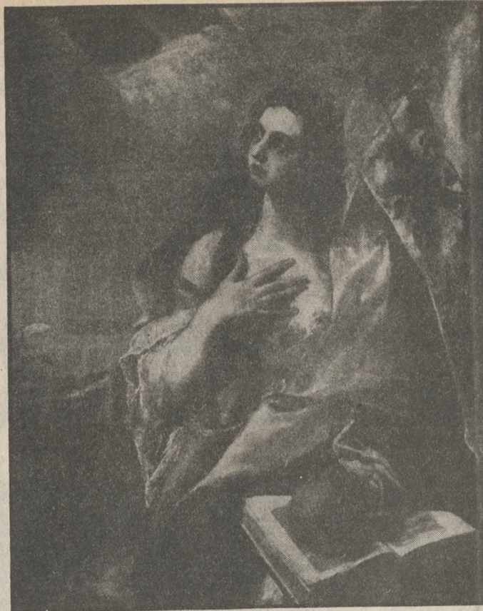
Γοργόρα φίλος και θαυμαστής του Δομήνικου θα γράψει αργότερα στην θνήτ του εκείνο το διακρύβροτο σονέτο που μεταξύ άλλων λέει: Yaze el Griego. Heredo naturaleza Arte, y el arte estudio, Iris colores, Febo luzes, si no sombras Morfeo. Την Τρίτη: ΔΟΜΗΝΙΚΟΣ ΘΕΟΤΟΚΟΠΟΥΛΟΣ «Η ΚΑΤΑΓΩΓΗ ΤΟΥ»

Οι Ισπανοί προφέροντας το όνομα El Greco διαπιστώνουν δυο πράγματα. Το πρώτο το Καλλιτέχνη στο Πάνθεον των Ισπανών ζωγράφων και την ελληνικότητα του. Λογοτέχνης και ποιητής της εποχής στα δόκμα και στα ποιήματά τους τον αναφέρουν «Έλληνα». Τα ονόματα του φίλου του Paragincino γι' αυτόν αρχίζουν χαρακτηριστικά: Divino Griego... Ya Fuesse Griego ofensa... Del Griego aqi lo que encerrarse... Ο υψηλόπνοος και λυρικότατος ποιητής