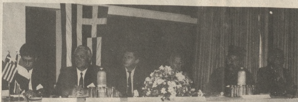
Στημιότυπα από την χθεσινή πρώτη ημέρα του Ευρωπαϊκού Συμποσίου