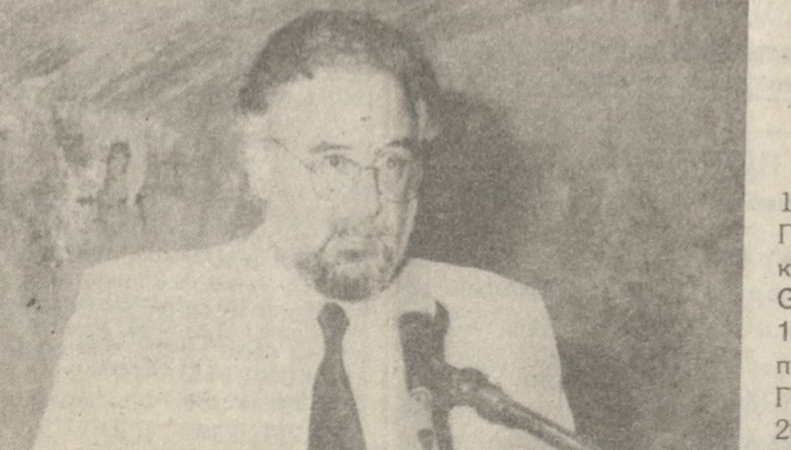
Στην Κρητική καταγωγή του Θεοτοκόπουλου αναφέρθηκε ο μορφωτικός ακόλουθος της Ισπανικής Πρεσβείας στην Αθήνα κ. Jose L. Melena

τηνα έργα του Γκρέκο σε ιδιαίτερα προσιτές τιμές, για εκείνους που δεν θα μπορούσαν να αποκτήσουν τους κάπως ακριβούς καταλόγους. Οι πύλες και των τριών αιθουσών έκλεισαν ξανά ερμητικά στις 5 το απόγευμα, αφού δυο ώρες αργότερα, στις 7 μ.μ. ο Δήμαρχος Ηρακλείου επρόκειτο να εγκαινιάσει και επίσημα τον «ερχομό» του ζωγράφου στην γενέτειρά πόλη τους.