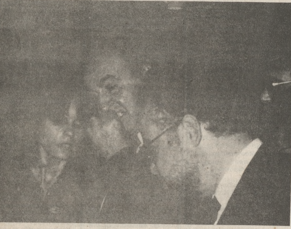
-Κύριε πρόεδρε μήπως θάπρεπε περισσότερο διακριτικά να ξεκοκαλίσετε την ασφάλιση;