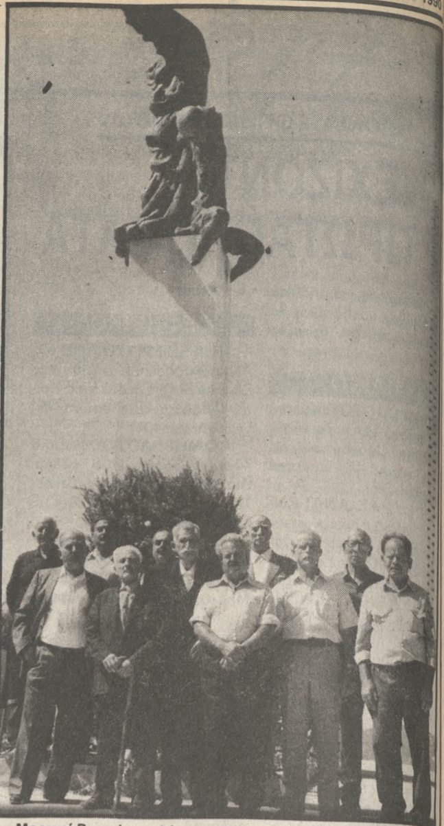
Μερικοί Βιαννίτες γλύτωσαν το εκτελεστικό απόσπασμα από τη μανία των Γερμανών. Τους βλέπουμε στη φωτογραφία μπροστά στο Ηρώο που δημιουργήθηκε για να θυμίζει τη θυσία της επαρχίας

Προσωπικά, θεωρώ πολύ περιορισμένες τις διαστάσεις του εγχειρήματος. Και πολύ, πάρα πολύ περιορισμένη τη συμβολή του σαν αιτία στα γεγονότα που το ακολούθη-