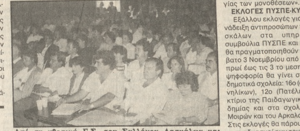
Από τη χθεσινή Γ.Σ. του Συλλόγου Δασκάλων και Νηπιαγωγών.

Τη συνεργασία με τους συλλόγους γονέων και κηδεμόνων και με όλους τους κοινωνικούς φορείς του Ηρακλείου, για την επίλυση του προβλήματος της σχολικής στέγης αλλά και των άλλων προβλημάτων της εκπαίδευσης, αποφάσισαν στη χθεσινή γενική συνέλευσή τους οι δάσκαλοι και οι νηπιαγωγές του Νομού.