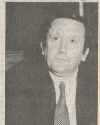
απευθυνθείτε στον κ. Κιουλάρα! Αθάνατε Έλληνα... Όλα τα «σφάξεις» όλα τα... «μιλώνεις»...