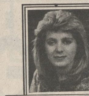
Γράφει η αισθητική ΜΑΡΙΑΝ ΣΦΑΚΙΑΝΑΚΗ

Πλατεία Κορνάρου 31 Στάδ Γαλιεράκη, 1ος όρ. (Βαλιδέ Τζαμί) Τηλ. Ιατρ. 285.434, Οικ. 238.501 Δέχεται καθημερινά εκτός Σαββάτου.