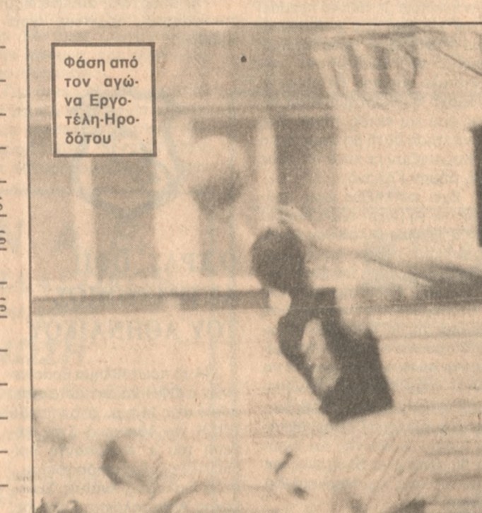
Φάση από τον αγώνα Εργοτέλη-Ηρόδοτου