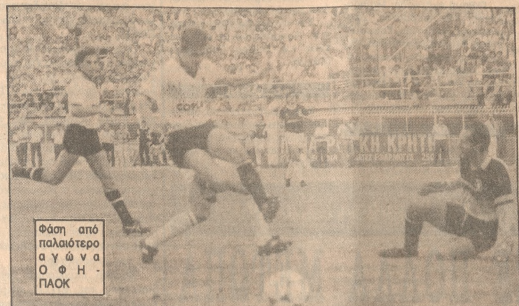
Φάση από παλαιότερο αγώνα ΟΦΗ-ΠΑΟΚ