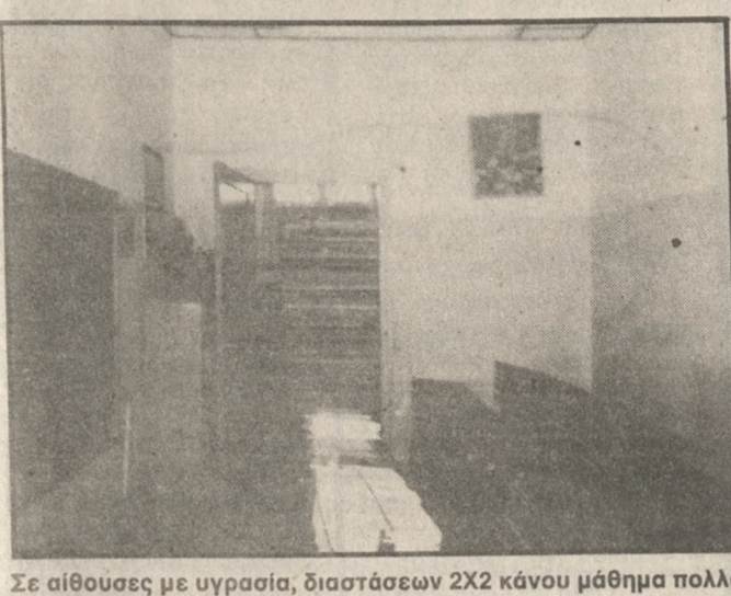
Σε αίθουσες με υγρασία, διαστάσεων 2Χ2 κάνουν μάθη πολλά παιδιά Ηρακλειωτών.

Η απάντηση του υπουργού Παιδείας κ. Κοντογιαννόπουλου-που αποκάλυψε πρόσφατα η «Π»-σε ερώτηση βουλευτών του Συνασπισμού για την κατάσταση της σχολικής στέγης στο Ηράκλειο, ήταν η αφορμή για υποβολή και ψήφιση εισήγησης στην οποία περιγράφεται το όλο πρόβλημα και προτείνονται λύσεις, από το νομαρχιακό Συμβούλιο Ηρακλείου. Όπως αναφέρεται στη σχετική εισήγηση των μελών του Ν.Σ. Ηρακλείου κ.κ. Παπαδάκη και Λεβεντάκη, η εγρήγορση από το Υπουργείο Παιδείας κ. Κοντογιαννόπουλου στην από 3-10-90 ερώτηση βουλευτών του Συνασπισμού σχετικά με τις στεγαστικές ανάγκες της Πρωτοβάθμιας και Δευτε-