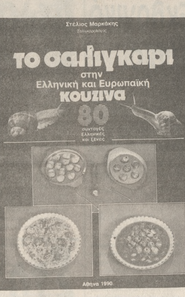
Και τα δύο βιβλία περιέχουν εγχρωμες φωτογραφίες και αποτελούν μια επιμελημένη και προσεγμένη έκδοση. Διατίθεται στα βιβλιοπωλεία του Ηρακλείου.