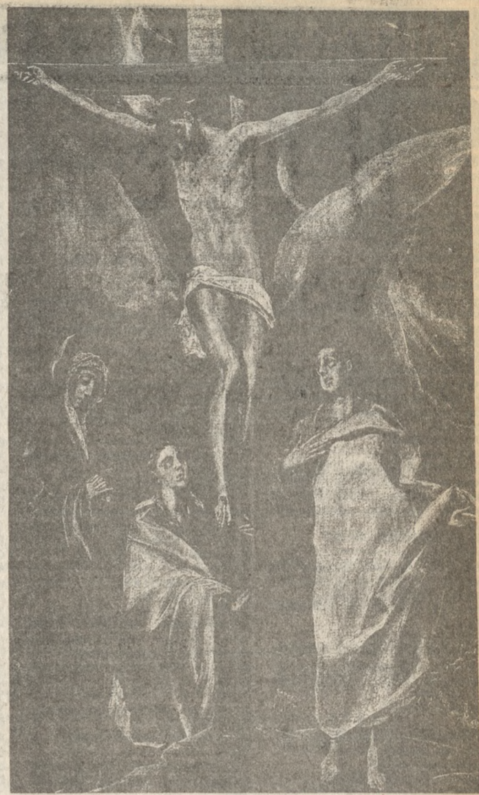
Θαύμα Δομήνικος Θεοτοκόπουλος, ανακαλύπτουμε το παλαιότερο θαύμα Ελλάδας. Μ.Σ.: Να πράγμηναι «στην ζωγραφική του το Θεό διακρίνεται, γίνεται ορατό μέσα στην φύση και η φύση μέσα στο Θεό» όπως λέτε, να μου επιτρέψετε μόνο μια μικρή συμπληρωματική παρατήρηση. Οτι η φύση τελικά και μ' αυτήν εννοώ την φυσικοκρατική αντίληψη του χώρου που τελούσαν τα εικαστικά δρώμενα στον Θεοτόκοπουλο, υποτάσσεται τελείως στην veritas subjektiva στην υποκειμενική δηλαδή αλήθεια της δικής του θεώρησης που διέδιδε στις προετοιμασμένες και στην φύση απλά της δευτεροβάθμια και αλληγορική σημασία του χώρου. Με τα λόγια σας «φτιάχνει έναν κόσμο που σε αποσπά από τούτον τον κόσμο και σε μετεωρίζει μέσα σε αυτόν...» μου θυμίζετε τις οραματικές περιγραφές της Αγίας Τερέζας της Αβίλα από την οποία επηρεάσθηκε στο έργο του ο Δομήνικος. Υποστηρίζει δηλαδή ότι τα βιώματα του οραματισμού είναι υπερφυσικά κι όμως είναι εικόνας απ' αυτή τη φύση, απ' αυτή τη ζωή ή όπως η ίδια λέει: «εικόνες όπως δεν ζωγράφισες ποτέ καλλιτέχνης μέχρι τώρα και που τα πρότυπά τους δεν υπάρχουν πουθενά κι όμως είναι αυτή η ίδια η φύση η ίδια η ζωή η πιο τέλεια μορφοποίηση που μπορεί κανείς να σκεφθεί».