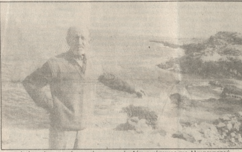
Από αυτό το σημείο περνάει ο αγωγός, λέει ο κάτοικος της Αλικαρνασσού

Αγώνια, αγωνία αλλά και δικαιοσύνη γιατί απ' τους ίδιους κρατήθηκε «κρυφό» το εφέρασμα χθες οι κάτοικοι της Αλικαρνασσού με την αποκάλυψη της «Π» ότι ένα δίκτυο μεταφοράς καυσίμων περνάει κάτω από τα σπίτια των κατοίκων τους, και οι κάτοικοι τώρα πλένουν απ' τους αρμούς να δώσουν λύση στο πρόβλημα, να εξαφανιστούν οι ενδεχόμενοι κίνδυνοι, οι οποίες τόνιζαν στην εφημερίδα μας, χθες το πρωί, οι οποίοι έχουν υποχρέωση να λάβουν μέτρα και να σταματήσουν την λειτουργία του δικτύου. Την ίδια ώρα ο περιφερειακός αντιπολιτευόμενος της Κρήτης Γιώργος Σεβαστιάδης δημοσιογράφος ότι είναι θα εξεταστεί κι αν δεν ληφθεί τα μέτρα «προ-