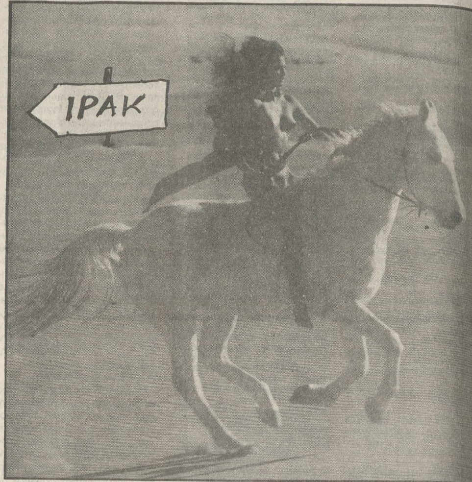
Του Κ. ΔΙΑΚΑΙΝΙΣΑΚΗ