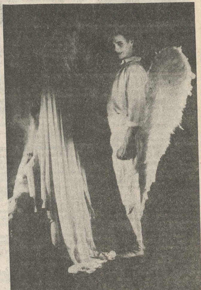
Στις 30 Νοεμβρίου