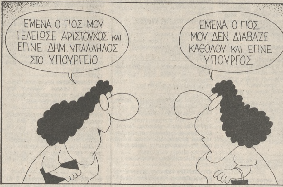
ΤΟΥ ΚΥΡ από τις ΕΙΚΟΝΕΣ ΗΤΑΝ ΛΑΘOΣ