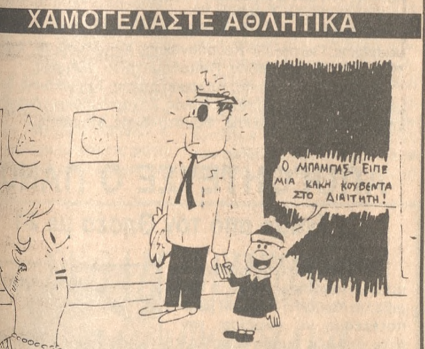
Ο ΓΙΑΝΝΗΣ ΘΕΜΕΛΗΣ σχολιάζει την επικαιρότητα