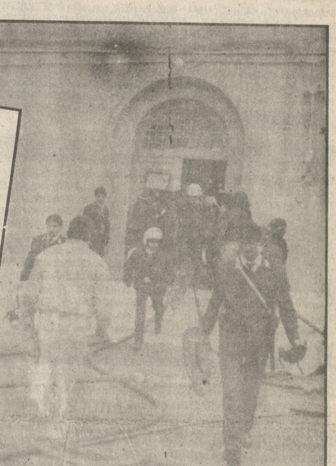
Το έργο εξετελέσθη. Η στάση κατεστάλη

πλευρά των αστυνομικών και ανάβοντας φωτιές. Την ίδια ώρα στο δεύτερο όροφο μια ομάδα φυλακισμένων προσπάθησε να επιτεθεί.