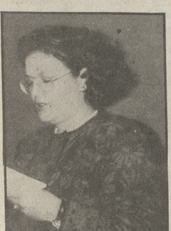
H κ. Μαχαιρά

Συγκεκριμένα σοβαρό ρόλο ...στην διάσωση των ασθενών ...παίζει η γρήγορη ενημέρωση ...του γιατρού σχετικά με τον τρό- ...πο που έγινε η οξεία δηλητη-