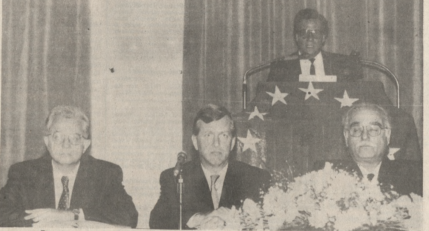
Στιγμιότυπο από την τελετή έναρξης των εργασιών του 1ου Συνεδρίου Ελληνικών Ευρωπαϊκών Κέντρων Πληροφοριών.

Εξελίχσαν χθες το απόγευμα οι εργασίες του 1ου Συνεδρίου των Ελληνικών Ευρωπαϊκών Κέντρων Πληροφοριών