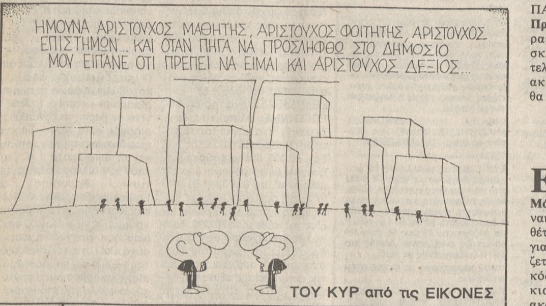
ΤΟΥ ΚΥΡ από τις ΕΙΚΟΝΕΣ

Ο ΠΡΩΝΗ πρωθυπουργός κ. Γ. Ράλλης μίλησε χθες το βράδυ σε εκδήλωση του Συλλόγου αποφοίτων Επιτελείων Εθνικής Άμυνας στο πολεμικό μουσείο, με θέμα τη γλώσσα μας ως εθνικό ζήτημα. Ο κ. Ράλλης τάχθηκε υπέρ της επαναφοράς των Αρχαίων Ελληνικών στα Γυμνάσια, όχι όμως με τις μεθόδους διδασκαλίας του παρελθόντος, αλλά με τη διδασκαλία τους από δόκιμες μεταφράσεις, παράλληλα με τη διδασκαλία της Νεοελληνικής Γλώσσας χωρίς ακρότητες. Αυτό -είπε- ότι θα βοηθήσει τους σημερινούς νέους οι οποίοι πάσχουν από «λεξιπενία» όπως τόνισε χαρακτηριστικά. Ο πρώην πρωθυπουργός επέρριψε την ευθύνη για τη γλωσσική κατάσταση των νέων μας σήμερα στις κυβερνήσεις του ΠΑΣΟΚ, λέγοντας ότι η γλωσσική μεταρρύθμιση που είχε ξεκινήσει ο ίδιος, ήταν υπουργός Παιδείας το 1976, διακόπηκε μετά το 1981, με αποτέλεσμα «να έχουμε σήμερα αυτή την κατάσταση στα σχολεία μας αλλά και τους νέους μας γενοκότερα». Η απλή επαναφορά των Αρχαίων Ελληνικών -είπε ο κ. Ράλλης- θα ήταν απελές να πιστεύουμε ότι θα αποβεί πανάκεια. Άρτια γλωσσική κατάρτιση και άνοψη κατανοήσι του αρχαίου κειμένου: με αυτές τις προϋποθέσεις θα έχει επιτυχία η επαναφορά των Αρχαίων Ελληνικών. Αλίμονο!