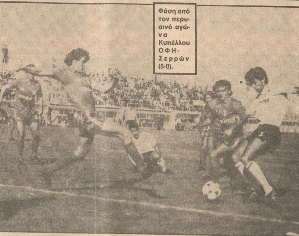
Φάση από τον περυσινό αγώνα Κυπέλλου ΟΦΗ-Σερρών (5-0).

Ο πρόεδρος της ΕΠΑΕ κ. Γιώργος Δεδες πρότεινε στην Εκτελεστική Επιτροπή της Ένωσης να τηρηθεί ενός λεπτού σιγή στους αγώνες της μεταπροσεχούς Κυριακής, στη μνήμη του Λάζαρου Χαραλαμπίδη.