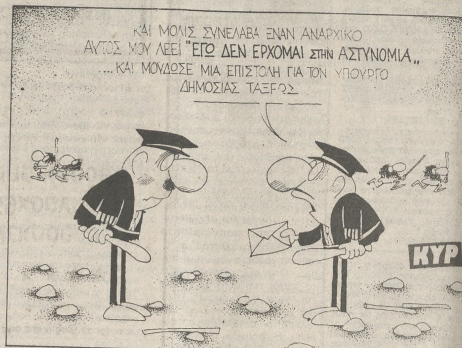
ΚΑΙ ΜΟΛΙΣ ΣΥΝΕΛΑΒΑ ΕΝΑΝ ΑΝΑΡΧΙΚΟ ΑΥΤΟΣ ΜΟΥ ΛΕΕΙ 'ΕΓΩ ΔΕΝ ΕΡΧΟΜΑΙ ΣΤΗΝ ΑΣΤΥΝΟΜΙΑ...