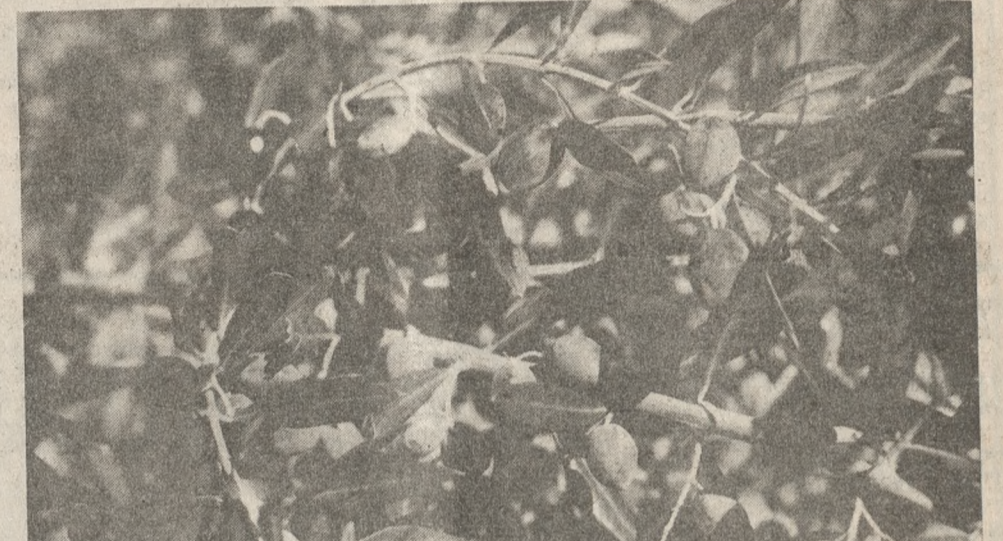
Η ανακοίνωση παράλληλα δίνει μια εικόνα για την πορεία των καλλιεργειών. Η πορεία αυτή είναι: - Ελιά: Συνεχίστηκαν οι εργασίες της δακοκτονίας. Η κατάσταση του ελασιόκρηπου γενικά δεν είναι καλή λόγω της παρατεταμένης ανομβρίας. Υπολογίζουμε την φετινή παραγωγή λαδιού περί τους 30.000 τόννους. - Αμπέλι: Συνεχίστηκε η παράδοση της σταφίδας στους κατά τόπους Συνεταιρισμούς και Ενώσεις. Επίσης κατά τον μήνα Οκτώβριο τοξείωσε και η εξαγωγή του Ροζακί. Τον μήνα αυτό εξήχθησαν 1280 τόννοι. - Κηπευτικά: Συνεχίστηκε η παραγωγή κηπευτικών από τις υπαίθριες καλλιέργειες. Η καλλιέργεια του αγγουριού στα θερμοκήπια είναι μειωμένη συγκριτικά με πέρυσι. Οι εξαγωγές γίνονται κανονικά και κατά τον μήνα Οκτώβριο εξήχθησαν 7.565 τόννοι αγγουριού με μέση τιμή περίπου 65 δρχ. το κιλό στα χέρια του παραγωγού. - Ανηθ: Οι καλλιέργειες των γαρυφαλλιών είναι μειωμένες σε σύγκριση με τις περυσινές. Οι φυτείες εξελίσσονται κανονικά. Εξαγωγές δεν είχαν αρχίσει μέχρι τέλους Οκτωβρίου. ΚΤΗΝΟΤΡΟΦΙΑ Συνεχίστηκαν οι τοκετοί της ποιμενικής προβατοτροφίας. Αρνιά έχουν πουληθεί αρκετά από τους πρώτους τοκετούς. Οι τιμές στα χέρια των κτηνοτρόφων ήταν περί τις 950 δρχ. το κιλό. Επίσης άρχισε η λειτουργία των τυροκομείων. Επιζωστίες γενικά στα αιγοπρόβατα δεν παρουσιάστηκαν.

Στην ίδια ανακοίνωση σχετικά με τις βροχοπτώσεις, σημειώνεται ότι στο νομό αυτές δεν ήταν εξιόχως, όμως στην πόλη του Ηρακλείου και γύρω από αυτή, έπεσε μια αξιόλογη βροχή που μετρήσε κόπες το πρόβλημα της ξηρασίας. Τον Οκτώβριο έπεσαν: Ηράκλειο 45 χιλ., Κασσέλη 20 χιλ., Μοίρες 7 χιλ., Αρκαλοχώρι 5 χιλ., Τυμνάκι 3 χιλ.