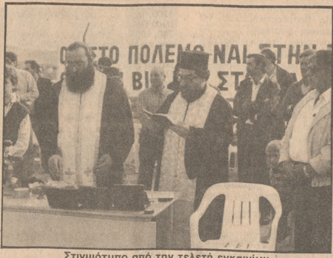
Στιγμιότυπο από την τελετή εγκαίνιων

■ Την... ανάλυση των αγώνων στους οποίους υπάρχουν αμφισβητούμενες φάσεις σε συγκέντρωση που θα πραγματοποιείται κάθε εβδομάδα στα γραφεία του Συνδέσμου με την παρουσία του διαιτητικού «τρίου» και των παραγόντων των ενδιαφερομένων ομάδων.