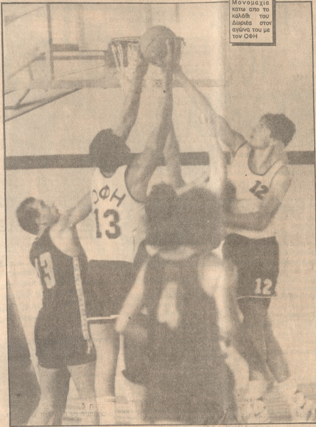
Μονομαχία κατά από το καλάθι του Δωριέως στον αγώνα του με τον ΟΦΗ

Β' ΕΘΝΙΚΗ ΓΥΝΑΙΚΩΝ ΕΓΙΝΑΝ την Κυριακή οι συναντήσεις της 3ης αγωνιστικής, με τα εξής αποτελέσματα: