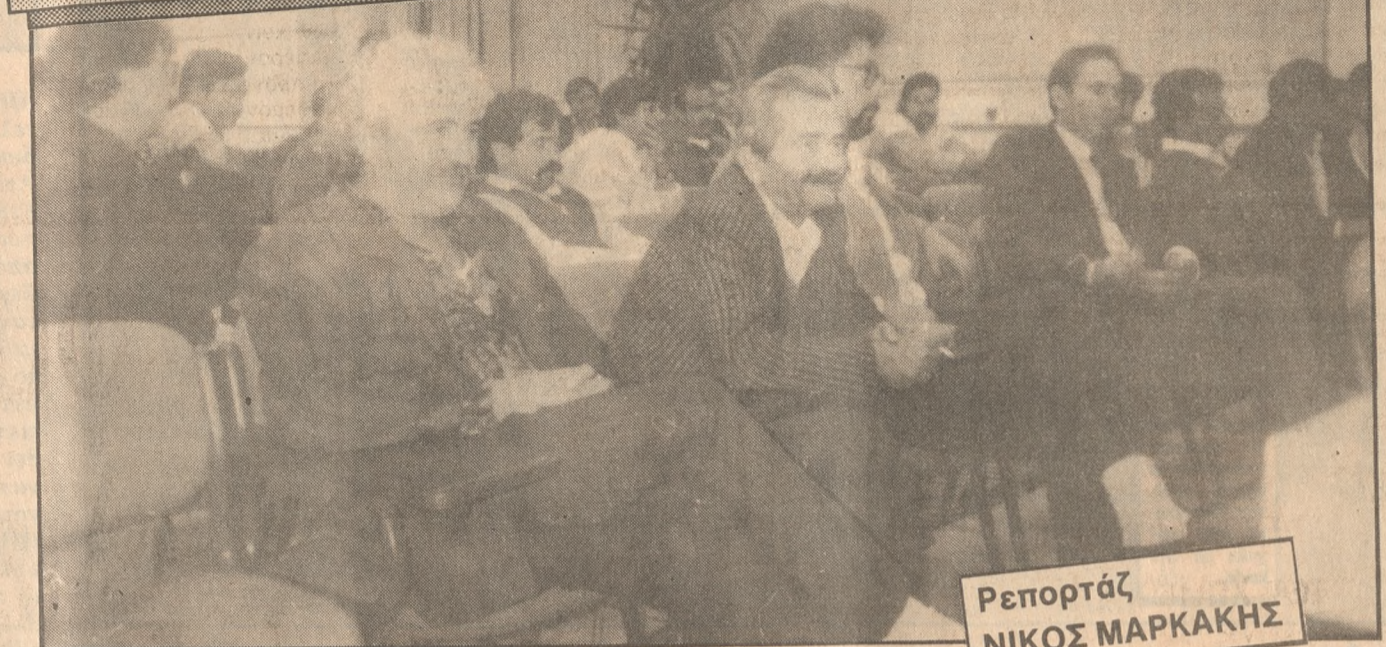
Ρεπορτάζ ΝΙΚΟΣ ΜΑΡΚΑΚΗΣ

Δεν δόθηκαν λύσεις στη σύσκεψη για την βία στους αγωνιστικούς χώρους