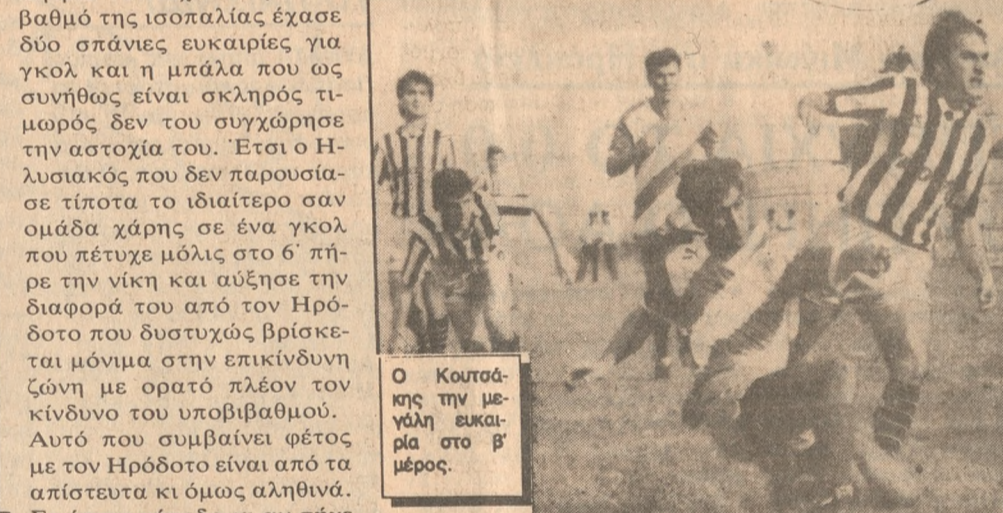
Ο Κουτσάκης την μεγάλη ευκαιρία στο 6' μέρος.

του Ηρόδοτου ο Τσακανί- κας εκμεταλλεύθηκε αδρά- νεια της άμυνας και με προβολή από το ύψος της περιοχής έκανε το 1-0. Στο 22' απ' ευθείας φάουλ του Αολάνη αποκρούστηκε από το δοκάρι του Μίσα. Στο 43' ο Καρακατσάνης με μακρινή μπαλιά έβγαλε τε- τα-τετον Βάσιο, που πλάσ- σαρε αδύναμα πάνω στον Γιαουρτά. • ΗΛΥΣΙΑΚΟΣ: Μίσας, Γραμμένος, Τζιόλας, (63 Φώτης), Τριανταφύλλου, Συνοδινός, Γούναρης, Κα- ρακατσάνης, Χριστινάκης, Καλιμάνης, Τσακανίκας, Βάσιος (84' Χερσίης). • ΗΡΟΔΟΤΟΣ: Γιαουρτάς, Σέκερης, Ασλάνης, Αγαπη- τός (70 Μαρκάκης), Τσιρά- κος, Βασιλείου, Γιαννής, Σουτζής (32 Μπασιουνάς), Πετράκης, Ψωμάς, Κου- τσάκης.