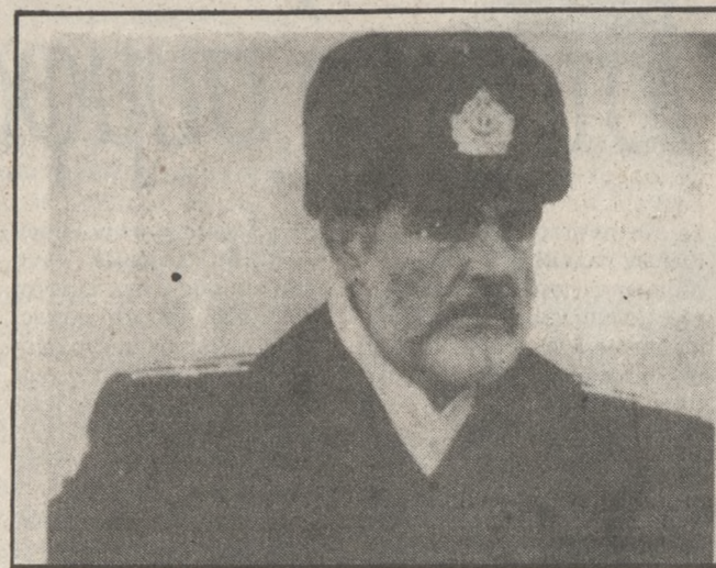
Ο Συν Κόνερι, στην ταινία «Το κυνήγι του κόκκινου Οκτώβρη».

Ο Σαλβατόρε πετυχημένος σκηνοθέτης, επιστρέφει μετά από τριάντα χρόνια στο χωριό όπου γεννήθηκε, με αφορμή