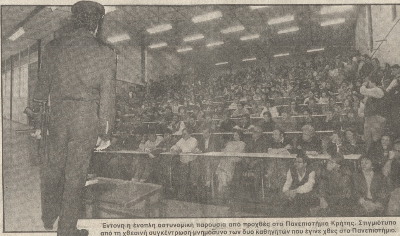
Έντονη η ένοπλη αστυνομική παρουσία από προχθές στο Πανεπιστήμιο Κρήτης. Στιγμιότυπο από τη χθεσινή συγκέντρωση-μνημόσυνο των δύο καθηγητών που έγινε χθες στο Πανεπιστήμιο.

«υπεύθυνος» για τη μη επισημοποίηση του εφέλιξη. Κι ενώ σήμερα συμπληρώνεται μια εβδομάδα από το διπλό φονικό στο Ερευνητικό Κέντρο και οι έρευνες για το δράστη είναι άκαρπες, αξιωματικοί της αστυνομίας εξεφράζαν χθες, για πρώτη φορά, την άποψη ότι ο Πετροδασκαλάκης μπορεί και να έχει διαφύγει από την Κρήτη και να βρίσκεται ήδη στο εξωτερικό. Στην περίπτωση αυτή, οι ίδιοι αστυνομικοί πιστεύουν ότι ο φονιάς έχει ανθρωπίνως που τον βοηθούν στις κινήσεις του.