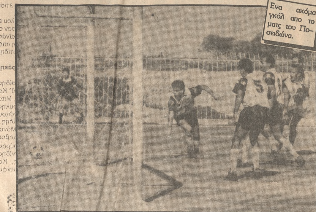
Ενα ακόμη γκολ από το ματς του Ποσειδώνα.