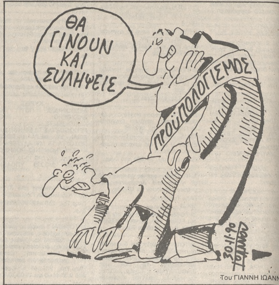
Του ΓΙΑΝΝΗ ΙΩΑΝΝΙΝΟΥ

«ΝΑ βγείτε έξω και να ενημερώσετε τον κόσμο!» Αυτή την προτροπή-εντολή έδωσε ο Πρωθυπουργός στους βουλευτές και στα στελέχη του κόμματός του μετά τις τελευταίες διαπιστώσεις ότι «δεν τα πάμε καλά με την προβολή του κυβερνητικού έργου και ο κόσμος έχει παραπάνω». Ποιός όμως είκοσε τον πρωθυπουργικό λόγο; Υποθέτω ελάχιστα αφού οι περισσότεροι τριγυρνούν από γραφείο σε γραφείο για ρυθμίσεις θεμάτων της πελατειακής τους αυλής. Και να ήξεραν τουλάχιστο τη ζημιά που κάνουν!