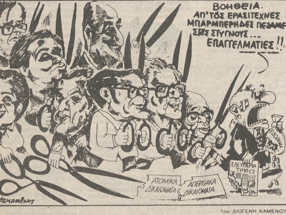
Του ΔΙΟΓΕΝΗ ΚΑΜΕΝΟΥ