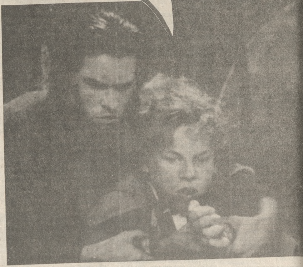
ΤΟ ΜΗΧΑΝΑΚΙ, ΡΕ...

ΚΙ ΕΚΕΙ ΜΠΑΜΠΑ ΠΟΥ ΝΟΜΙΖΑ ΠΩΣ Ο ΔΟΛΟΦΟΝΟΣ ΕΣΤΡΙΨΕ ΤΗ ΓΩΝΙΑ ΚΙ ΕΦΥΓΕ, ΝΑΣΟΥ ΚΑΙ ΠΛΑΚΩΝΕΙ Ο ΑΝΤΙΠΡΟΜΟΚΡΑΤΙΚΟΣ ΝΟΜΟΣ!