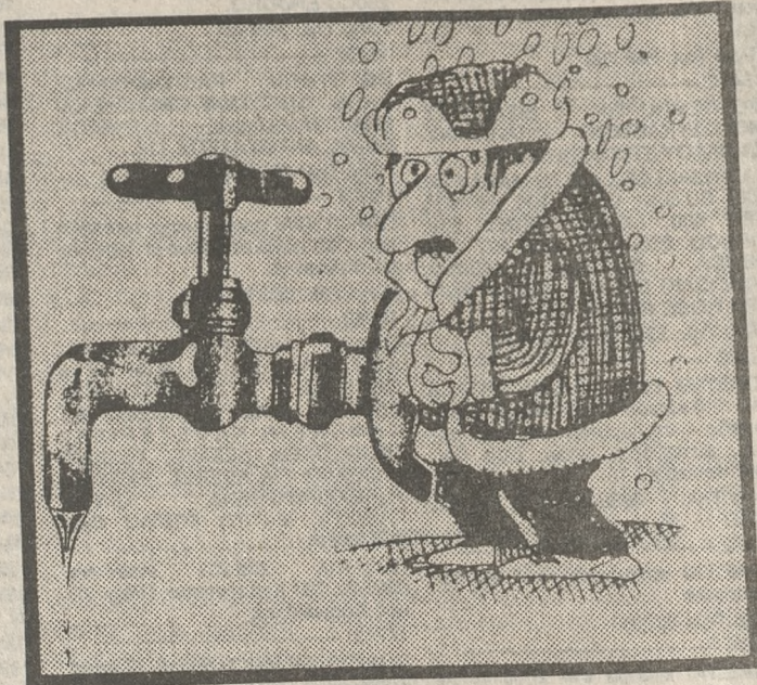
Από τον Ερυθρό Σταυρό

«Η υδροδότηση των παραπάνω κοινοτήτων των οικισμών γίνεται από γεώτρηση. Λόγω της λειψυδρίας και για πλήρη κάλυψη των αναγκών της περιοχής, Έχει ήδη ανοιχτεί και νέα γεώτρηση. Από την Νομαρχία έχουν συνταχθεί μελέτες αξιοποίησης προϋπολογισμού 23.500.000 δρχ. και σύντομα αρχίζει η εκτέλεση των έργων. Ο Σύνδεσμος Λευκοχωρίου έχει χρηματοδοτήσει από το πρόγραμμα αντιμετώπισης έκτακτων αναγκών λειψυδρίας με 2.800.000 δραχμές για το έτος 1990».