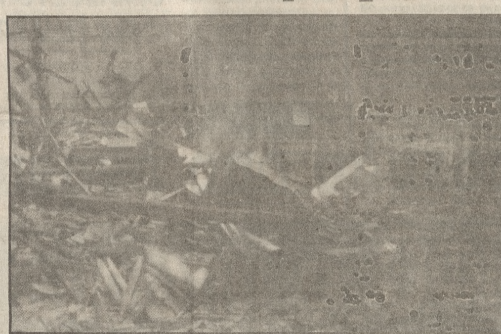
Δοκάρια, σανίδες και έπιπλα καπνίζουν αρκετές ώρες μετά την κατάσβεση της πυρκαγιάς.

«Κάρβουνο» έγινε χθες τα ξημερώματα ανασφάλιστο εργοστάσιο ξυλείας στη Λεωφόρο Σοφοκλή Βενιζέλου (απέναντι από τα γραφεία της ΔΕΗ)! Από την πυρκαγιά καταστράφηκαν ολοσχερώς έπιπλα, ξύλα και μηχανήματα ενώ υπήρξε σοβαρός κίνδυνος η φωτιά που σβή-