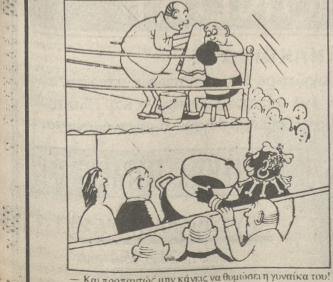
Και προπαντός μην κάνεις να θυμώσει η γυναίκα σου!