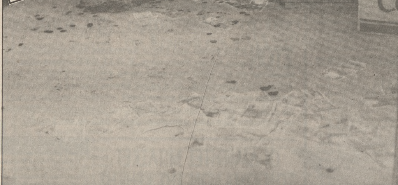
Χαρτονόμισματα των 5.000 και 1.000 δραχμών σκορπισμένα στο πάτωμα πάνω σε κηλίδες από το αίμα των θυμάτων

Ο Νίκος Ρουμπάκης είδε έναν άνδρα με μακριά μαλλιά να βγαίνει από το πρα-