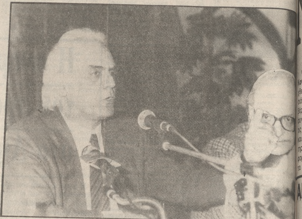
ΜΝΗΜΟΣΥΝΟ ΓΙΑ ΤΟΝ ΑΒΕΡΩΦ