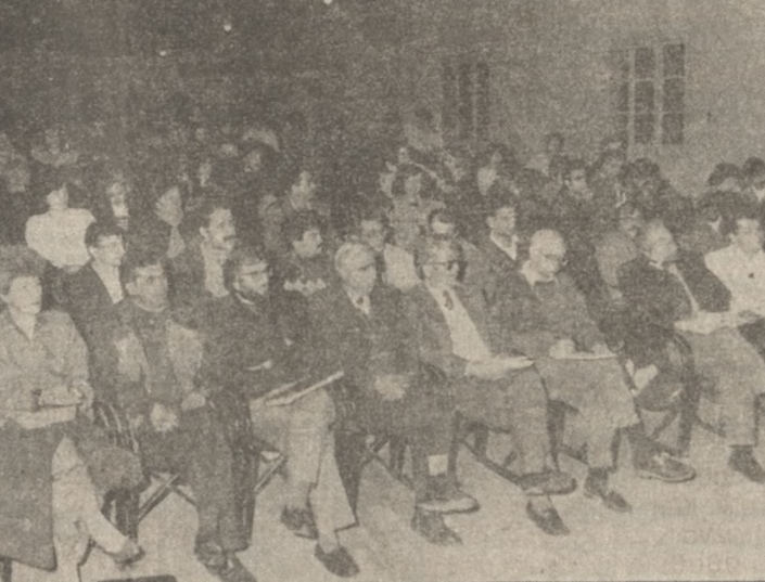
Από τις εκδηλώσεις στο θεατρικό σταθμό.

...κατά. ...Την μεγάλη απήκηση των... ...κινητοποιήσεων για την... ...εκπαίδευση και τις νέες... ...δυστάσεις που έχει πά... ...σει (κονδύλια για Παιδεί... ...απόσυρση Π.Δ.) με αποτέ... ...σμα οι δραστηριότητες για... ...την αναβάθμιση της Παιδεί... ...να παίρνουν νέα έκταση... ...Είναι χαρακτηριστικό ότι... ...σε προχθεσινή γενική συνέλ... ...ευση μαθητών Λυκείου (3ο),... ...208 μαθητές γήφισαν «υπέρ»... ...της κατάληψης και μόλις 15