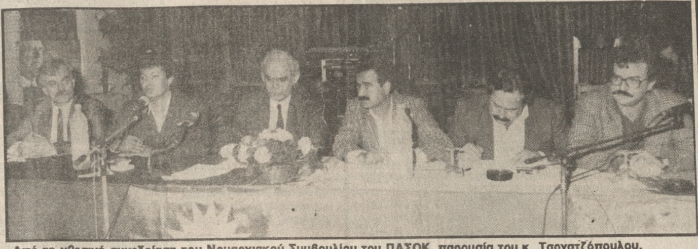
Από τη χθεσινή συνεδρίαση του Νομαρχιακού Συμβουλίου του ΠΑΣΟΚ, παρουσία του κ. Τσοχατζόπουλου.

...δικασίες που θα... ...στο... ...τους επόμενους... ...μέχρι τη συγκρό... ...του Εθνικού Συμ... ...βουλίου, παρουσίασε... ...χθες, στη διάρκεια της... ...πρώτης συνεδρίασης του... ...Νομαρχιακού Συμβουλίου... ...Ηρακλείου του Κινήμα... ...τος, ο Γραμματέας της... ...ΚΕ Άκης Τσοχατζόπου... ...λος. ...Ο Κ. Τσοχατζόπουλος εί... ...πε ότι στόχος είναι η κα... ...τά περιφέρεια σύγκλιση... ...Κοινωνικών και Πολιτιστι... ...κών προγραμμάτων, με... ...πρωτοβουλία του Τ.Ο.,... ...όσο διάστημα θα διαρκεί... ...η εξόρμηση του ΠΑΣΟΚ... ...Παράλληλα ανακοίνωσε... ...ότι την ερχόμενη άνοιξη... ...θα πραγματοποιηθεί Πα... ...νελλαδική συνδιάσκεψη... ...του Κόμματος. ...Στη χθεσινή συνεδρίαση... ...του Ν.Σ. του ΠΑΣΟΚ, στον... ...Αποσπερίτη, πήραν μέ... ...ρος βουλευτές, μέλη της... ...ΚΕ, της ΝΕ, των Τοπικών... ...και συντονιστικών Επι... ...τροπών, συνδικαλιστές... ...κ.α. ...Χθες το απόγευμα ο κ... ...Τσοχατζόπουλος έδωσε... ...συνέντευξη Τύπου και το... ...βράδυ μίλησε σε συνε... ...σίαση στο Αρκαλοχώρι.