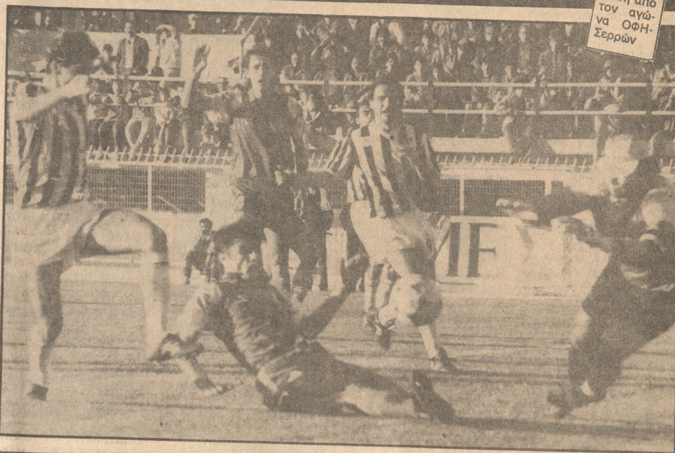
Φώση από τον αγώνα ΟΦΗ-Σερρών