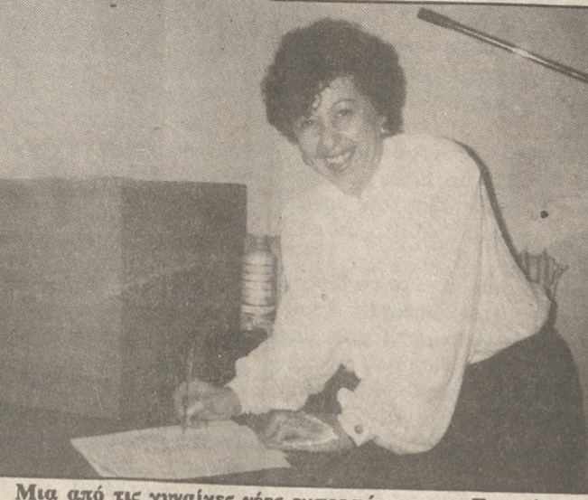
Μια από τις γυναίκες νέες εκπροσώπους της Τοπικής Αυτοδιοίκησης που ορκίστηκαν χθες