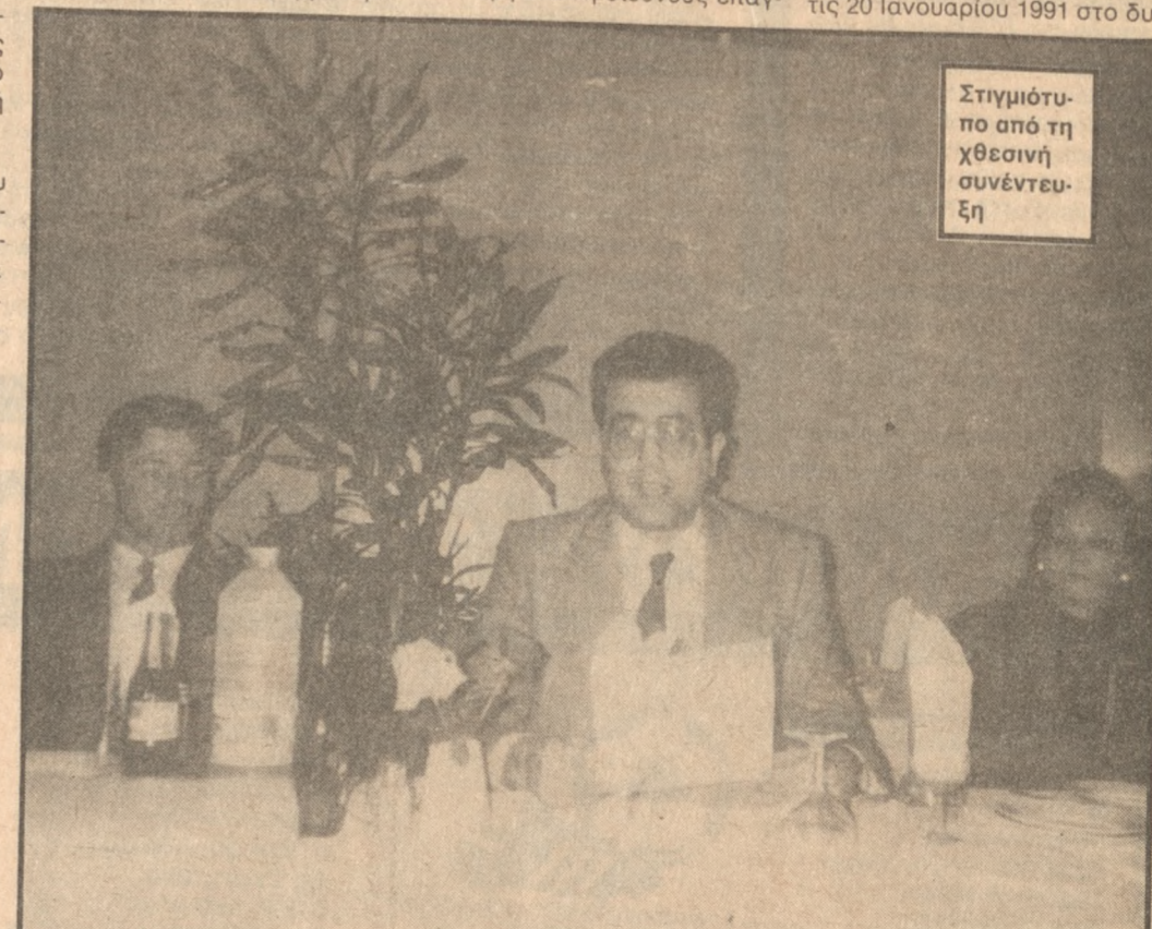
Στιγμιότυπο από τη χθεσινή συνέντευξη