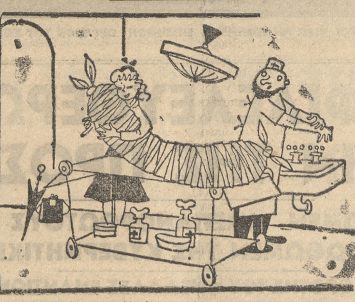
—'Ω αγάθη μου! 'Αγάθη μου! —Κυρία μου, τό κεφάλι είναι από την άλλη μεριά!