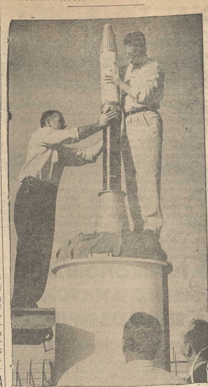
Τεχνικοί τοῦ Ἀμερικανικοῦ Στρατιοῦ συναρμολογοῦν τὸ τελευταῖον τμήμα τοῦ πυραύλου «ΖΕΥΣ Γ» καὶ τὸν τεχνητὸν δορυφόρον, ἄτινα θὰ παραμείνουν συγκεκολλημένα κατὰ τὴν διαδρομὴν τῆς ὀρισιτικῆς τροχιάς του. Αἱ δοκιμαὶ διὰ τὴν ἐκτόξευσιν συμπληροῦνται ἐσπευσμένως.