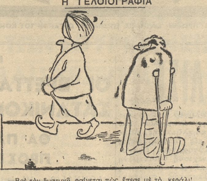
—Βρέ τόν δυστυχή, φαίνεται πώς έπεσε με τόν κεφάλι...

Κατά τήν πομπήν τού νεοσυλλέκτου. —Και τούώρα πού μάθαιμον τού κλίνατε επί δεξιά, θα μάθουμιν κ' τού κλίνατε επ' άριστερά. Είναι τού ίδιου με τού πρώτου, μόνο πώς είναι ντιλ κατά ντιλ... αντίθετο. Καταλάβετε ρε ζαγάρια;