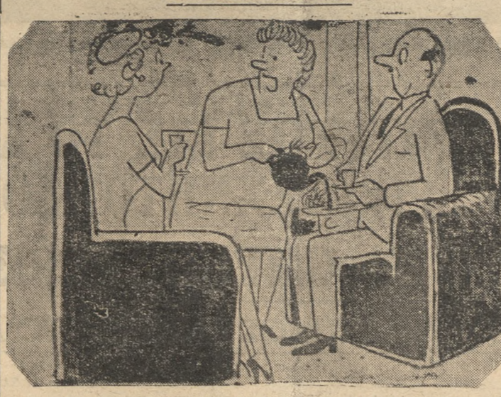
-Και στην άφηρημάδα δεν έχει τό θυμό τό άγαπητή μου...