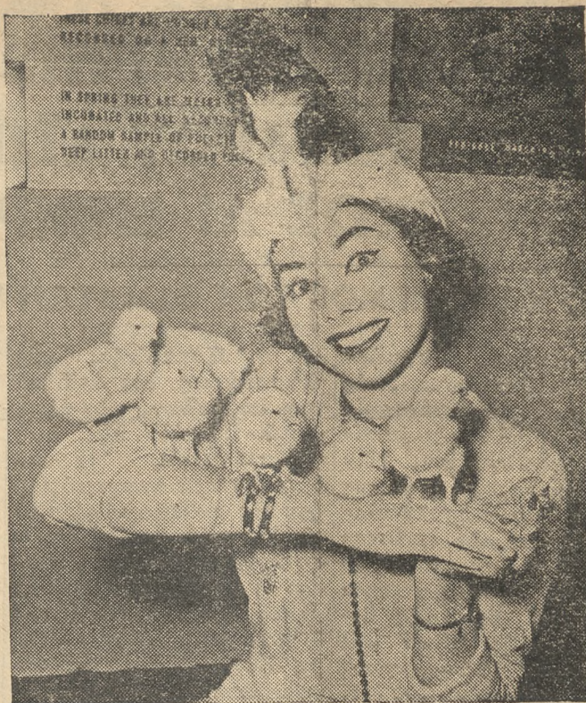
Η ηθοποιός Μάριγκολιν Ράσσελ έπεσκέφθη τελευταίας την Εθνική Έκθεση Πούλερικών του Λονδίνου και φωτογραφήθη μαζί με μερικά κοτοπουλάκια μιας ημέρας. Το καπέλλο που φορούσε ήτο από περσά κοτόπουλαν.