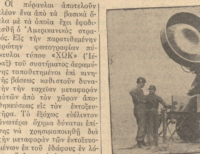
Χάρις έξ άλλου εις έν μοναδικόν εις άποτελεσματικότητα σύστημα ραντάο (εικόν δευτέρα) ένσωματωθέν εις

Τό διά πυραύλων «ΧΟΚ» σύστημα άεραμίνης καθίσταται δυνατόν εις τόν προαναφερθέντα πυραύλον να σφραγίσθαι τό «είδωλον» κινουμένου στόχου, εις χαμηλόν ύψος, άπό πληθώραν άνακλάσεων, προερχομένων άπό τό έδαφος, ώς π. χ., άπό λόφους, κτίρια και κορυφάς δένδρων. Τό Ραντάο «ΧΟΚ» δίδει τήν δυνατότητα εις ένα πυραύλον να παρακολουθήσθαι και καταστροφήν επιτιθέμενα μαχητικά άεροπλάνα, άκόμη και εις ύψος 10—20 μ. ύπεράνω του έδάφους. Τό εν λόγω ραντάο επισημαίνει αυτομάτως τόν στόχον, μη έπηρεα-