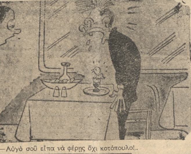
—Αυτό σοφ είπα να φέρης όχι κοτόπουλο!.