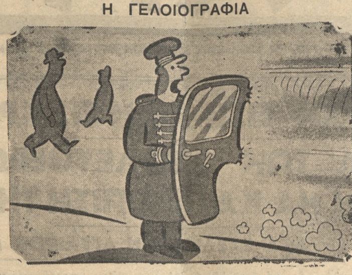
Όταν ο θυραρός είναι χερσόναντος...

Συνεχίζονται οι χοροί και οι μασκαράδες αλλά εφέτος οι Απόκορες, κατά το καλαμπούρι είναι μάλλον... Απόκορες.