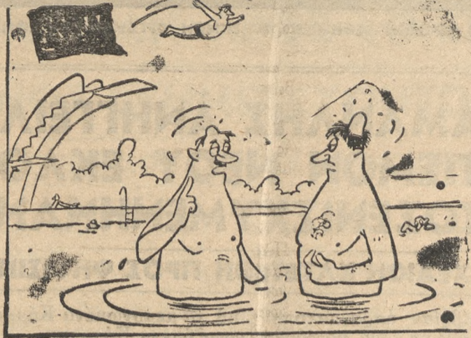
—Εγώ παίρνω βουτιές, τουλάχιστον από δέκα μέτρα. Μπα εγώ μόνο από τρία...