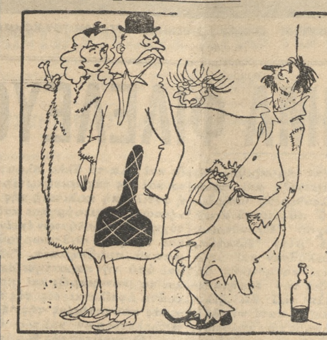
Ο ΕΠΑΙΤΗΣ: Μάλιστα κύριε πίνω για να ξεχνά τήν πείνα μου!