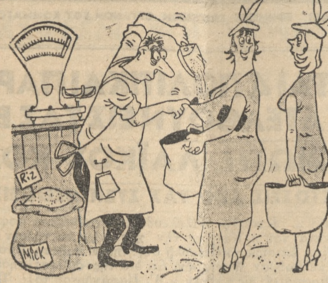
Όταν ο μπακάλης είναι μωφ...