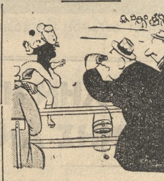
'Αν έτρεχε πιδ σιγά, θα ήταν καλύτερη...