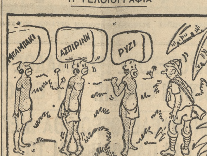
—Αυτός παραπονείται ότι είναι βαρύ το φορτίο και ότι του έφερε πονοκέφαλο...