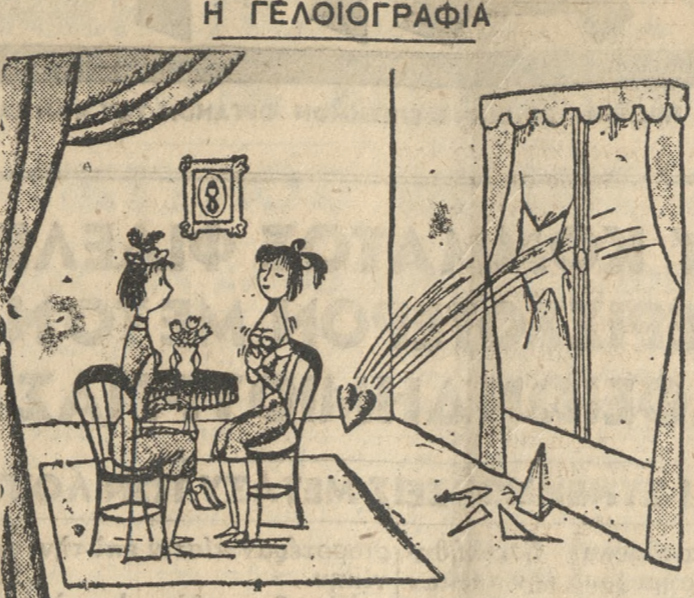
—Τά χαλάσαμε και μου επιστρέφει την... καρδιά μου!.