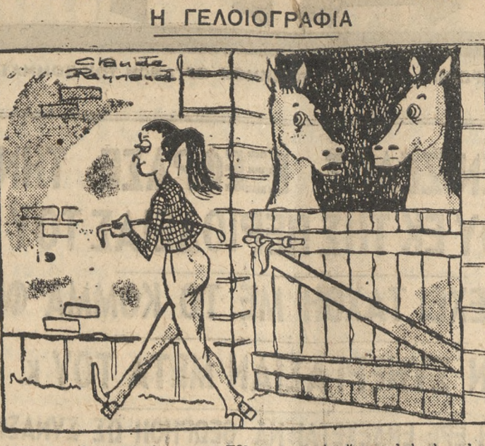
Μεταξύ άλλων: Είδας που την έχει αυτή την ούρα