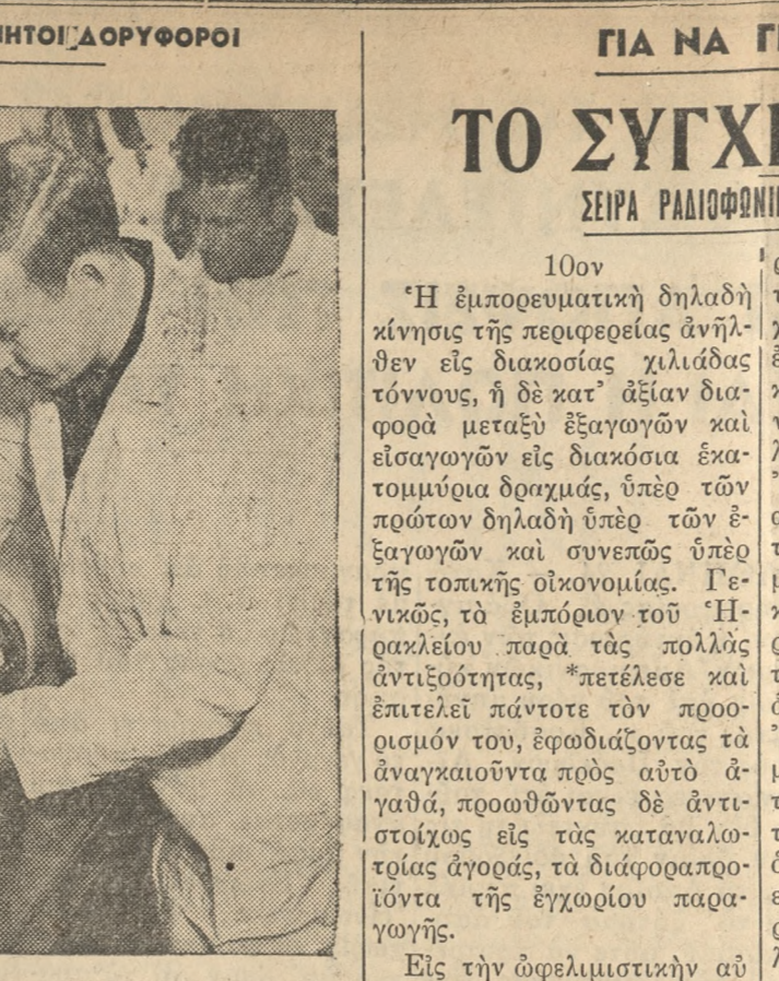
ΚΕΙ-Π ΚΑΝΑΒΑΡΑΑ, ΦΛΟΡΙΝΤΑ —Τεχνιτὸς δορυφόρος τὸ γένος «ΕΞΕΡΕΥΝΗΤΗΣ» καὶ ὁ πύραυλος πρῶτος τοῦ ἐλέγχονται ἀπὸ ἐπιστήμονας τοῦ Ἐργαστηρίου Πρῶτος τοῦ Ἐραίου μένον τοῦ Τεχνολογικοῦ Ἰνστιτούτου Καλοφρονίας, προτὺ προσαρμοσθῶν εἰς τὴν συσκευὴν ἐκτοξεύσεως τοῦ πυραύλου «ΖΕΥΣ Γ».

ΔΠΟΛΛΩΝ Τὴν Δευτέραν 13 ΕΚΚΛΗΜΑΤΑ ΖΗΤΟΥΝ ΕΝΟΧΟ ΧΕΝΡΥ ΦΟΝΤΑ - ΒΕΡΑ ΜΑΪΛΣ