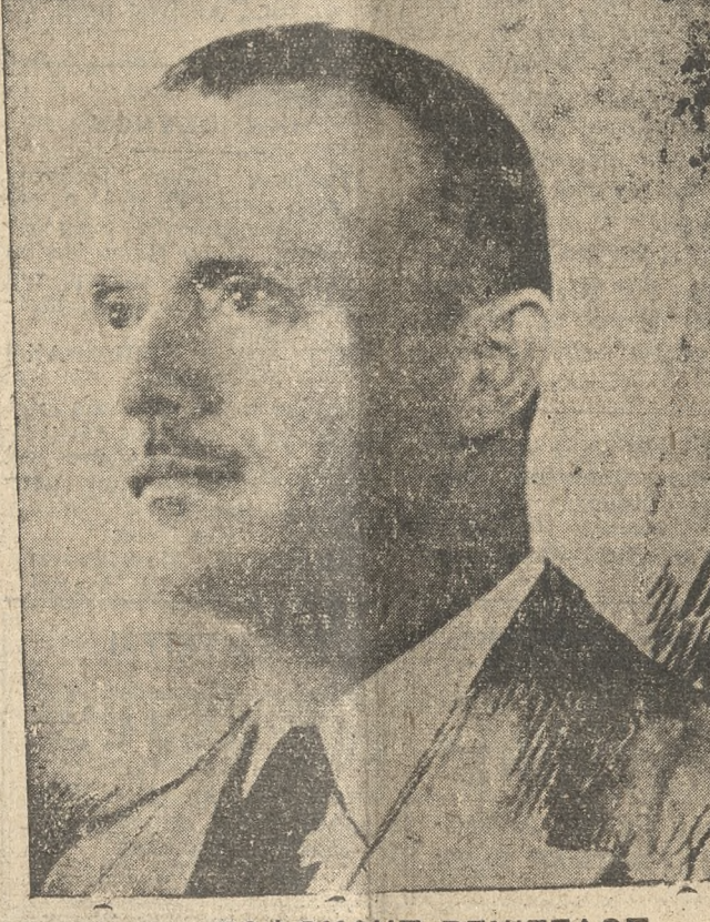
Ο Κ. ΣΟΦΟΚΛΗΣ ΒΕΝΙΖΕΛΟΣ

αν και θα καταλάβη με μεγάλην πλειοψηφίαν.