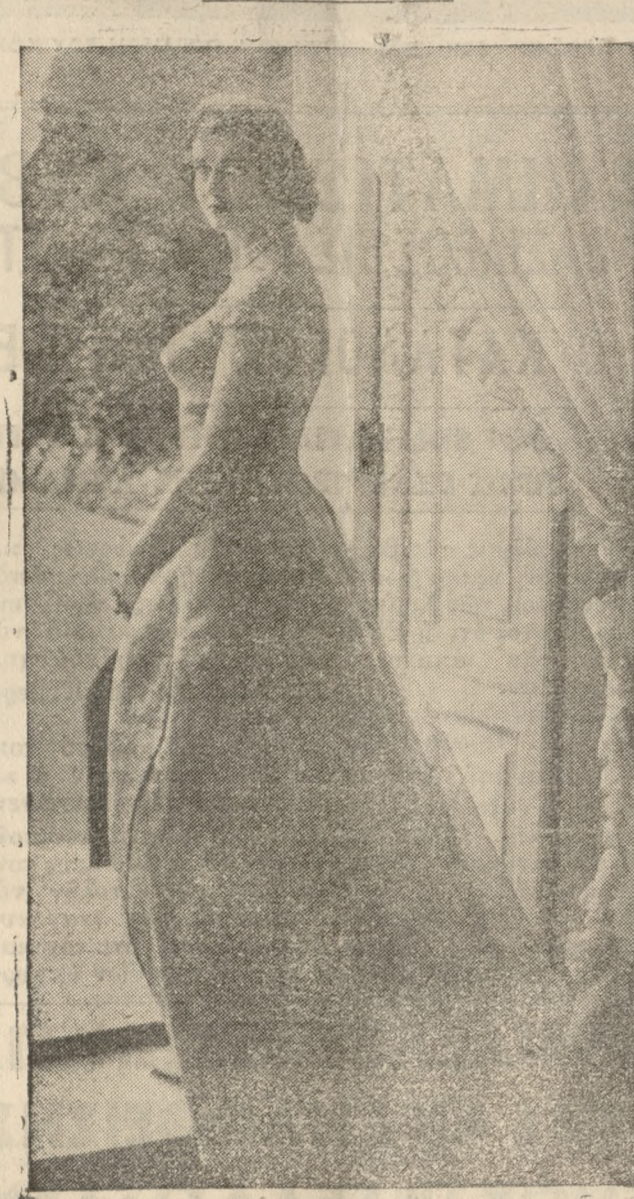
Πολύς λόγος έγινε πρό καιρού διά τήν κλοπήμιας βαλίτσας τής πριγκηπισσής Άλεξάνδρας τού Κέντ θυγατρής τής δουκίσσης τού Κέντ Μαρίνας, ή όποία περιείχε βαρύτιμα κοσμήματα αυτής. Είς τήν φωτογραφίαν ή πριγκηπισσα Άλεξάνδρα, ή όποία συνεπλήρωσε πρό τίνος, τή 21 έτος τής ηλικίας τής.