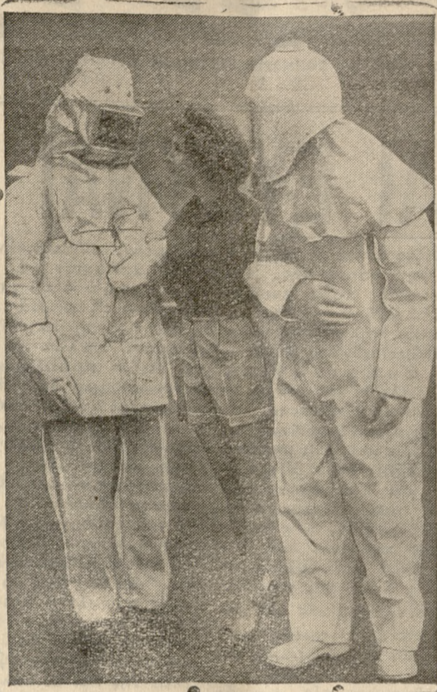
Έχει και τό έργοστάσιον τήν μόδα του. Αύτα είναι οι νέα προστατευτικά στολά οι όποια χρησιμοποιούνται εις τά όμοια έργοστάσια από τους έν αυτούς έργοζωμένους. Εις τήν εικόνα ή Μάρτζερο Σάντφορν διάσημο μακενέ, με νάλλον σόρτες και μπλοζ'ά ανάμεσα εις δύο άλλα μοντέλλα με στολάς άσφαλείας

Η νέα Κυβέρνησις... σχηματίζεται συνεχώς στα Καφενεία όπου οι... παντογνώστες συζητήτες προβλέπουν τήν διανομή των Υπουργικών θώκων, θά κανχόνται μετά ότι έτσι ακριβώς τό είχαν προβλέψη.