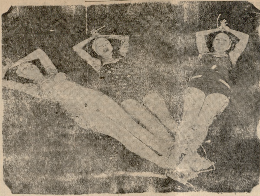
Δεμένες πόδια— χέρια οἱ τρεῖς οὐτὲς κοπέλλες, ἐκτὸς ἀπὸ... τὰς ἐαυτὰς τῶν ἐπιδεικνύουσιν καὶ τὰ προσόντα ἐνὸς νέου τύπου μαγίῳ ποὺ μὴ ποῦν νὰ χρησιμοποιηθῇ καὶ ὡς σοσιβίου. Ἐνδὲν διαφέρει ἐκ πρώτης ὄψεως ἀπὸ τὰ συνήθη κοστούμια μάνιου, ἢ κατασκευῆς τοῦ εἶναι τέτοια ποὺ ἔχει καὶ ἱκανότητα σοσιβίου.