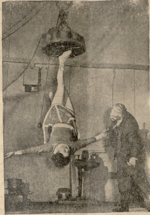
'Η κοπέλλα αὐτὴ ἐνὸς ἔφευγε ἀπὸ τὴν ἐργασίαν...