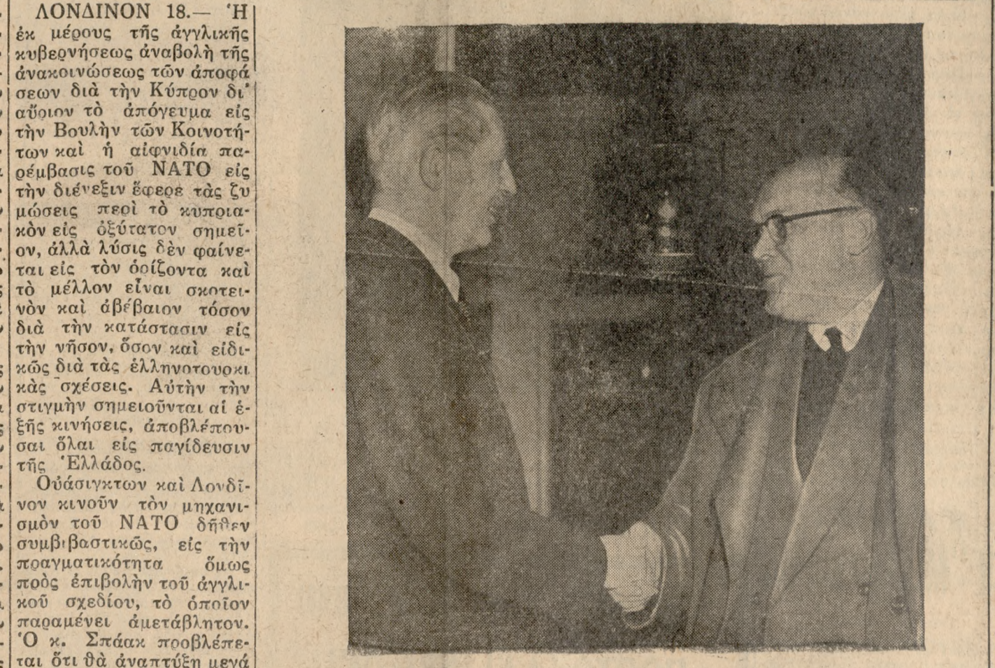
'Ο Γενικός Γραμματέας του ΝΑΤΟ κ. Σπάδακ, συνομιλόν με τον βρετανόν πρωθυπουργόν κ. Μάκ Μιλαν κατά πρόσφατον έπισκεψιν του εις Λονδίον. 'Η μεσολάβησις του ΝΑΤΟ εις τόν Κυπριακόν τήν τελευταίαν στιγμήν δέν παρέχει πολλήν έμπιστοσύ- νην ως προς τάς προβλεπόμεναις τής 'Ελλάδος.

ΛΟΝΔΙΝΟΝ 18.— 'Η έκ μέρους τής άγγλικής κυβερνήσεως άναβολή της άνακοίνωσεως των άποφά- σεων δια τήν Κύπρον δι- αύριον τό άπόγευμα εις τήν Βουλήν των Κοινοτή- των και ή αίφνυδια πα- ρέμβασις του ΝΑΤΟ εις τήν διένεξιν έφερε τάς έυ- μύσεις περί τό κυπρια- κόν εις όξυτάτον σημεί- ον, αλλά λύσις δέν φαίνε- ται εις τόν όρίζοντα και τό μέλλον είναι σκοτει- νόν και άβέβαιον εις τήν διά τήν κατάστασιν εις τήν νήσον, όσον και ειδι- κώς δια τάς έλληνοτουρ- κικάς σχέσεις. Αύτην τήν στιγμήν σημειούται αι έ- ξις κινήσεις, άποβλέπου- σαι όλοι εις παγίδευσιν τής 'Ελλάδος. Ούάσιγκτων και Λονδι- νον κινούν τόν μηχανι- σμόν του ΝΑΤΟ δήθεν συμβιβαστικώς, εις τήν πραγματικότητα όμως πρός έπιβολήν του άγγλι- κού σχεδίου, τό όποιον παραμένει άμετάβλητον. 'Ο κ. Σπάδακ προβλέπει ότι δια άναπτύξιν μεγά- λην δραστηριότητα, και τόπος, και εις τό έγγύς μέλλον, μετά τήν άνακοί- νωσιν των άγγλικών άπο- φάσεων. Δέν άποκλείεται ό κ. Σπάδακ επιδιώξει μίαν τριμερή διάσκεψιν εις τό πλαίσιον του ΝΑ- ΤΟ, με συμμετοχή ίσως των πρωθυπουργών 'Ελ- λάδος και Τουρκίας, αλλά τόυτο φαίνεται όκως ά- πίθανον δια τήν 'Ελλάδα. 'Επομένως, ή μεσολάβη- σις του είναι καταδικα- σμένη εις άποτυχίαν, άν δέν ύπάρξη τροποποίησις