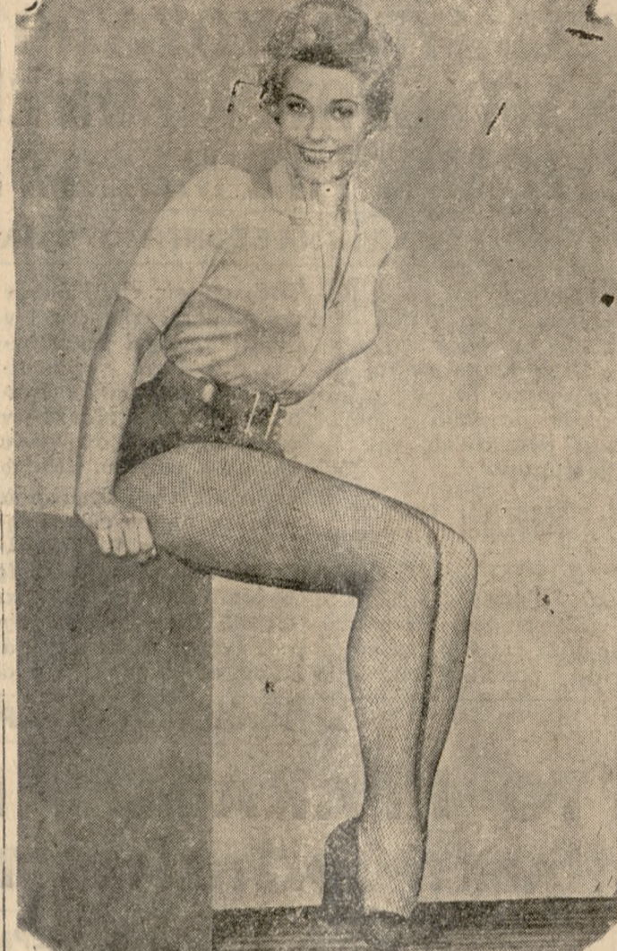
Η Τζέην Μούρ, τώ νέο άστρ τώ Χόλλυγουντ, πού άνέρχεται δλοταχώς εις τώ κινηματογραφικό στερέωμα.

Ενοικιά ζετα οικία νεόδη τος, πλήρης κατοικία έπι τής λεωφόρου «Μάχης Κρήτης» πλησίον "Εργοστασίου Τζουλάκη. Πληροφορία τηλ. 6.85.