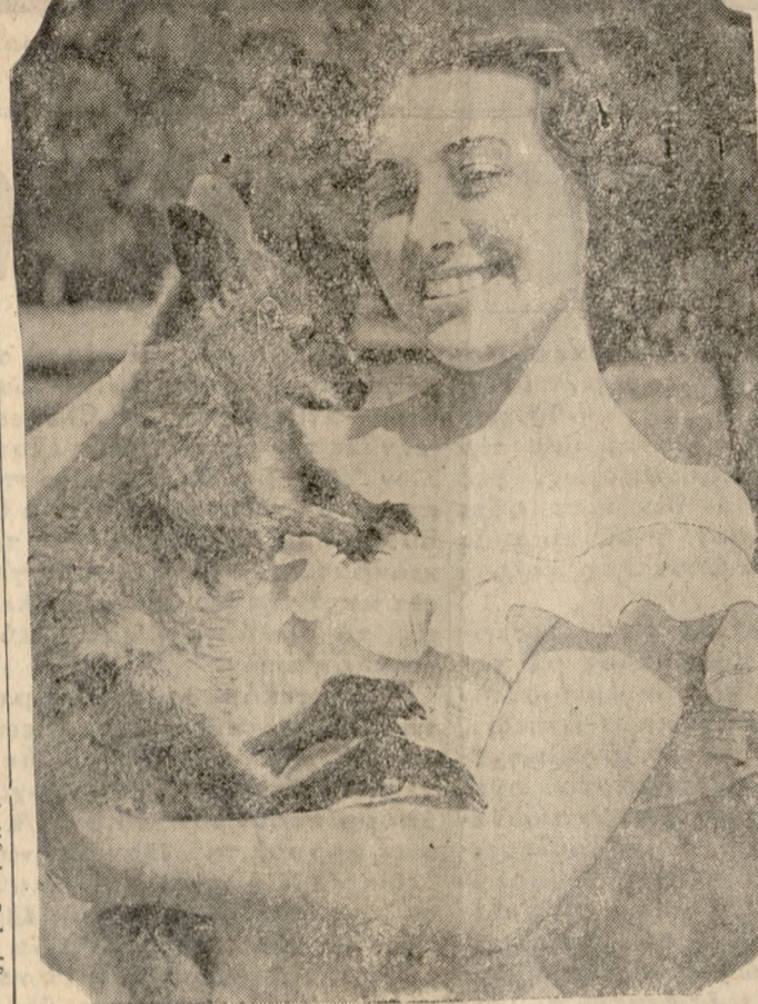
Εἰς τὸν ζωολογικὸν κήπον τῶν Πορσιῶν ὑπάρχει ἕνα σπάνιον μικρὸν ζῷον, τὸ «Γουόλφμπι». Τὸ χαριτωμένον αὐτὸ τετραπόδι ζῷον εὐμενὸν ὁμοιωθὲν ἔχει μίαν «καλοήγητην καὶ τρυφὴν νεοσσὸν Γαλλίδα» συγκινηθῆσαι καὶ ἀνελαβε νὰ υιοθετήσῃ τὴν αὐτὴν «Γουόλφμπι». Τώρα, βεθὴ μάννα καὶ υιοθετηθεῖσα, πεζάρουν ἐντυχεῖς πρὸ τοῦ φωτογραφικοῦ φακοῦ.