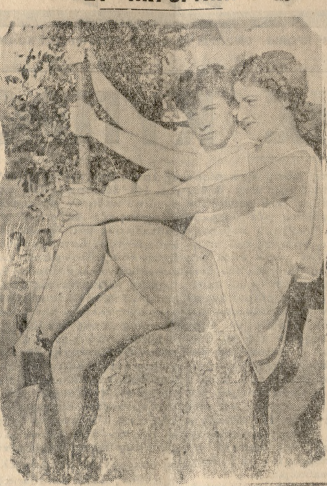
Μετά τώ μπάνιο, Εξοκούσμα στά βράχια.