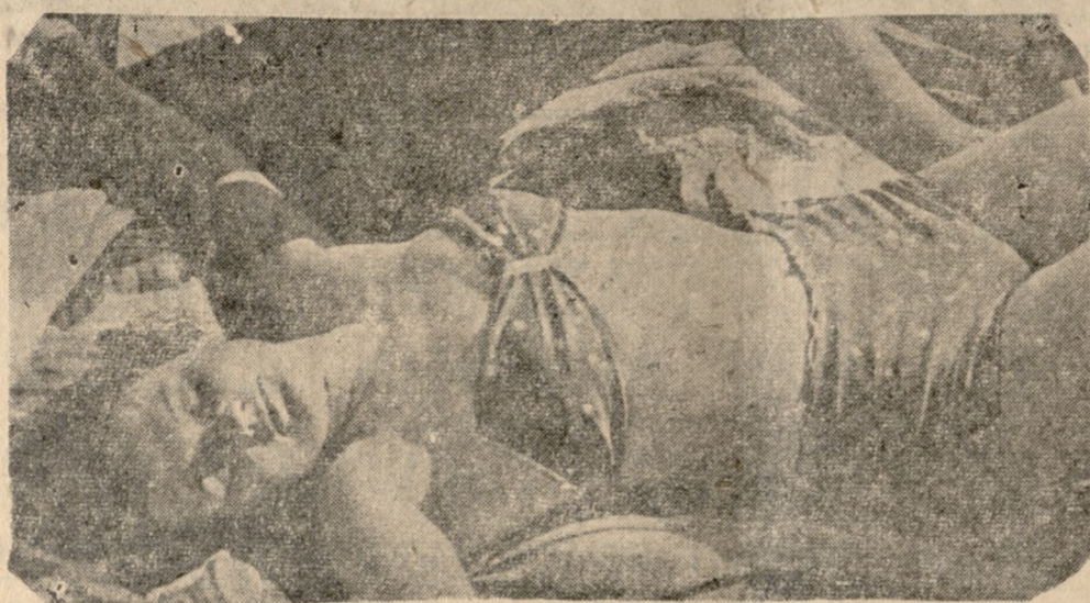
Μετά τὸ μπάνιο... παράδεισις στὶς θωπέιες τοῦ ἡλίου.