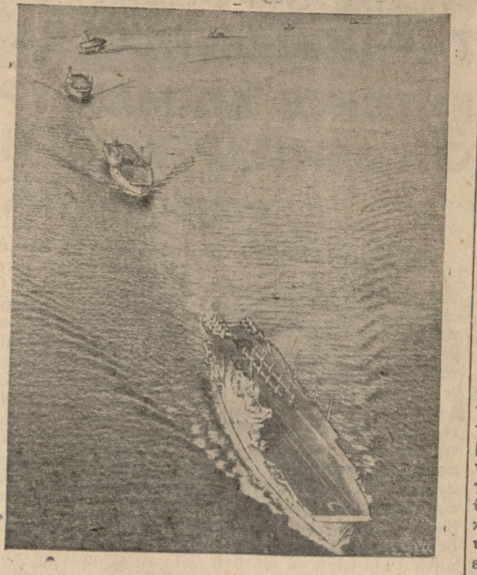
Αεροπλανοφόρα, θωρηκτά και άλλα πολεμικά σκάφη του βου Αμερικανικού Στόλου αδλακούνουν την περιοχή της Ανατολικής λεκάνης της Μεσογείου, η οποία λόγω των γεγονότων του Λιβάνου συγκεντρώνουν τον τελευταίον καιρόν την προσοχήν και το ενδιαφέρον των Δυτικών Δυνάμεων.