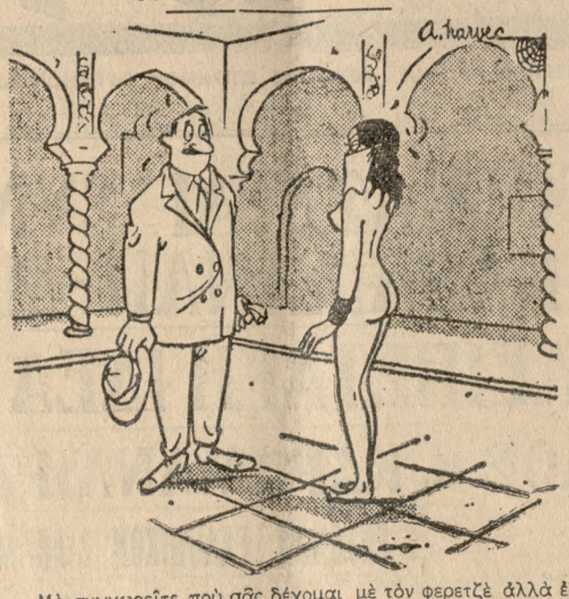
—Με συγχωρείτε που σας δέχομαι με τόν φερτζέ αλλά έδώ τά έθιμά μας... είναι πολύ άσχηρά!