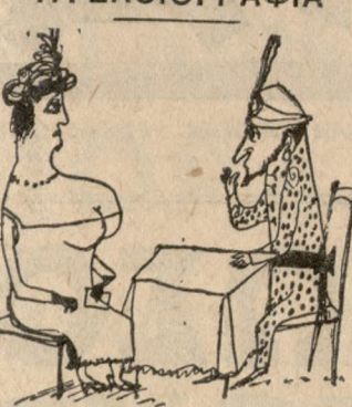
Με συγχωρείτε κυρία μου, 'Ε- χω πη λίγο και βλέπω δυό γυά- λινες σφαίρες...