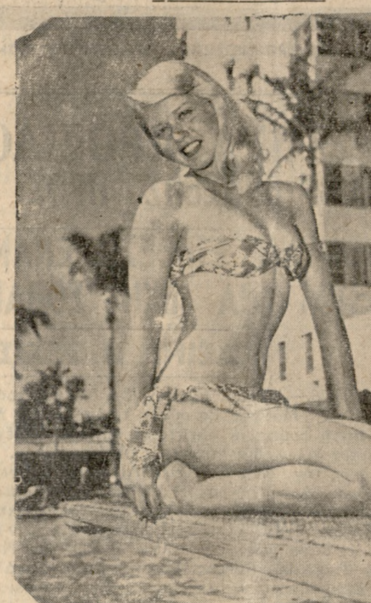
'Η νέα αποκάλυψις του Χόλλυγουντ είναι ή Μεξικανική Ντολορά Ριγκουέρα ή όποια με τήν ασύγκριτη όμορφία της, τό αγαλαματέιο σώμα της, και τήν άπρόσμιλλη τέχνη της πολύ γρήγορα θα μεσουρανήσιν εις τό κινηματογραφικό στερέωμα, ως άστρο πρώτου μεγέθους. 'Η όρασα Ντολοράς κάνει τώρα τίς διακοπές της στην κοσμική Λουτρόπολι του Μαϊάμι, όπου τήν συνάλεβεν ο φωτογραφικός φακός, μόλις βγήκε από τήν θάλασσα.